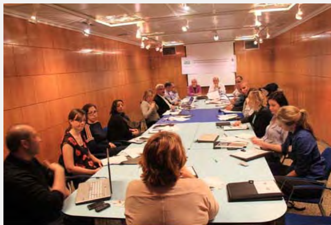
משתתפי סימפוזיון בספרד לגיבוש אסטרטגיה משפטית נגד ישראל, שאורגן ע"י PCHR (אתר PCHR, 23 באפריל 2013)

הארגון הפלסטיני PCHR, הממלא תפקיד מרכזי בלוחמה המשפטית נגד ישראל, פועל למנף את אירועי מבצע "עמוד ענן" להגשת תביעות משפטיות נגד אישים ישראלים. הוא גם דוחק ברשות הפלסטינית לנצל את מעמדה הבינלאומי על מנת לתבוע את ישראל בבית הדין הבינלאומי לפשעים בהאג