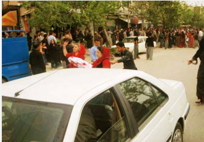
מחאת הנשים במריואן, מתוך: http://www.nnsroj.com/fa/detiles.aspx?id=4635&ID_map=20

העונש המשפיל שהוטל על הצעיר הכורדי עורר ביקורת חריפה וגילויי מחאה הן ברחבי העיר מריואן והן ברשתות החברתיות. יום למחרת ביצע העונש ארגנה אגודת הנשים של מריואן הפגנת מחאה ברחובות העיר בטענה שהלבשת פושע בבגדי נשים בתור עונש מהווה פגיעה בכבודן של נשים בכלל ובכבוד הנשים הכורדיות בפרט. בהפגנה השתתפו כמאה גברים ונשים. כמה מהמפגינות לבשו שמלות אדומות הדומות לבגד שבו הולבש הצעיר. בכמה דיווחים שהתפרסמו באתרי אופוזיציה איראנים נטען, כי במהלך הפגנת המחאה התפתחו עימותים בין הנשים המפגינות לכוחות ביטחון הפנים וכי כמה מהן אף נפצעו ( http://www.nnsroj.com/fa/detiles.aspx?id=4635&ID_map=20 ).