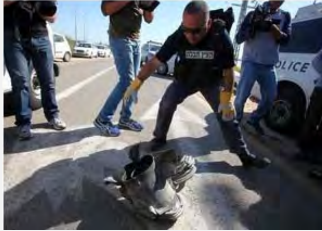
بقايا الصاروخ الذي سقط الى الجنوب من أشكلون