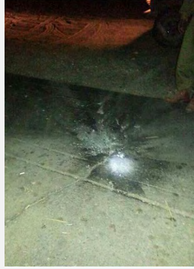
من اليمين: مكان سقوط قذيفة الهاون. من اليسار: شظايا على شكل كرات في قذيفة الهاون (المتحدثة باسم المجلس الاقليمي اشكول، 2 نيسان 2013)

3. صبيحة يوم 3 نيسان 2013، في ساعة خروج التلاميذ الى المدارس ورياض الأطفال، اطلق عدد من الصواريخ من قطاع غزة الى إسرائيل. وقد تم العثور على حالي سقوط في المناطق المفتوحة. وقد سقط أحد الصواريخ في منطقة نفوذ المجلس الاقليمي شاعر النقب. وقد تم اجراء تمشيط بحثا عن الصاروخ الثاني (صفحة شرطة إسرائيل على الفيسبوك). لم تقع اصابات بالأرواح ولا بالمتلكات.