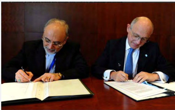
Los Ministros de Relaciones Exteriores de Argentina (a la derecha) y de Irán (a la izquierda) firman el memorándum de entendimientos para la realización de una “investigación conjunta” (25 de febrero de 2013, http://www.presidencia.gob.ar )

Argentina e Irán llegaron a un acuerdo para la realización de una “investigación conjunta” para examinar las circunstancias del atentado contra el edificio de la Comunidad Judía en Buenos Aires. Esto, a pesar de que una investigación oficial de las autoridades de Argentina indicaba claramente que tanto Irán como Hezbollah están por detrás de la iniciativa del atentado y de su realización.