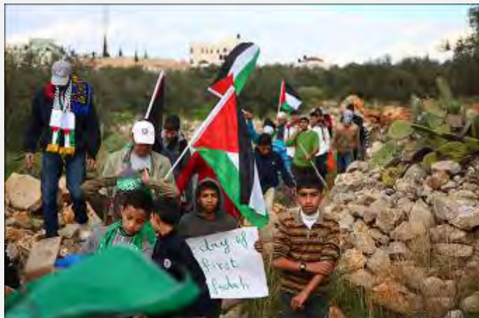
Флаги и символы Хамаса во время еженедельной демонстрации против забора безопасности в Билаине (ВАФА, 14 декабря 2012 г.)

символами Хамаса, которые уже давно не были видны на демонстрациях такого рода. В Калькилии был причинен материальный ущерб трем армейским транспортным средствам (ynet, 14 декабря 2012 г.).