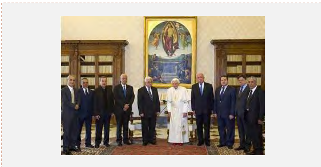
Махмуд Аббас во время встречи с римским папой Бенедиктом XVI (Шихаб, 17 декабря 2012 г.)