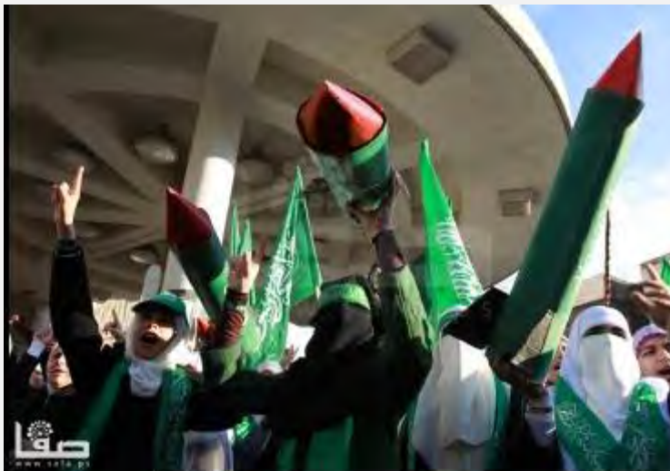
Демонстранты с макетами ракеты на митинге, посвященном 25 годовщине создания движения Хамас, состоявшемся в Шхеме (САФА, 13 декабря 2012 г.)