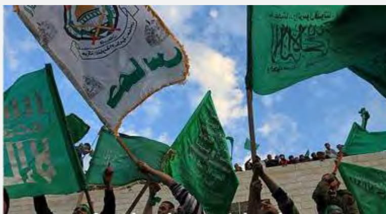
Участники митинга в Калькилии, состоявшегося 15 декабря, размахивают флагами Хамаса