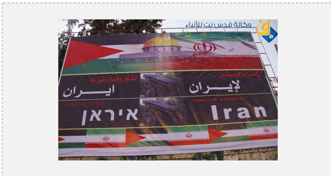
Плакат с выражением благодарности Ирану, снятый с близкого расстояния (Quds net, 29 ноября 2012 г.)

плане изображены устройства для запуска ракет, символизирующие ракеты Фаджр-5. Такие ракеты во время военных действий были впервые использованы для обстрела Тель-Авива и Иерусалима, двух крупнейших городов Израиля (интернет-сайт Pal Today, идентифицируемый с Исламским джихадом в Палестине, Reuters, 27 ноября 2012 г.).