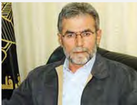
Ziyad al Nakhaleh: las armas que la Yihada Islámica en Palestina utiliza son de Irán. (canal al Arabia, 20 de noviembre de 2012).

2) Ziyad Nakhaleh rechazó rumores de que la escalada representa una materialización de un programa iranio, cuando dijo: “ ...las armas con que lucha la resistencia, y hasta las armas de Hamás, es armamento de Irán desde la primera bala hasta el cohete, y hasta lo que es fabricado localmente es de hecho iranio... ” (al Hayat, 18 de noviembre de 2012).