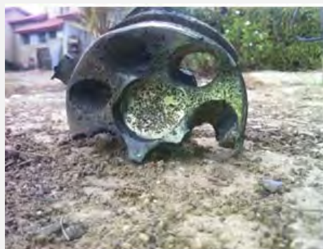
A la derecha: restos de un cohete que cayó cerca de una de las poblaciones. A la izquierda: la destrucción causada a una vivienda como resultado del impacto de un cohete. (Medios de comunicación de Sderot, 11 de noviembre de 2012)