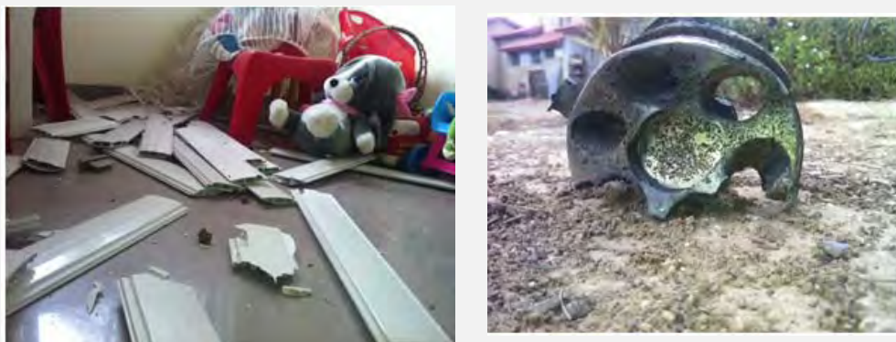
Gauche : Dégâts causés à un domicile par un tir de roquette. Droite : Débris de la roquette qui s'est abattue dans une localité du Néguev occidental (Sderot Media, 11 novembre 2012)

Néguev occidental dans le secteur du Conseil régional d'Eshkol. A 13h le 12 novembre, dix engins s'étaient abattus en territoire israélien.