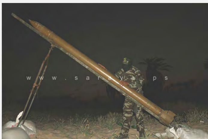
Version sophistiquée d'une roquette Quds que le JIP affirme avoir tiré sur Beersheba