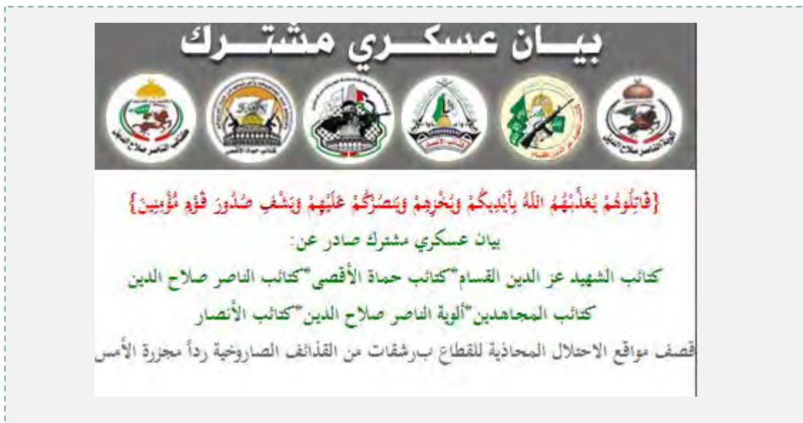
Logos des organisations terroristes figurant sur le communiqué publié sur le site Internet des Brigades Izz al-Din al-Qassam

6. La responsabilité de la plupart des tirs de roquettes a été revendiquée par diverses organisations terroristes, dont le Jihad Islamique Palestinien, les Comités de Résistance Populaire, le Front Populaire de Libération de la Palestine et plusieurs réseaux affiliés au jihad mondial. Le Hamas n'a revendiqué que peu d'incidents de tirs mais a soutenu les attaques. Ainsi, sur son site Internet, le Hamas a publié un communiqué conjoint de sa branche armée et d'autres organisations terroristes palestiniennes revendiquant la responsabilité commune des tirs de roquettes. Sur le site Internet des Brigades Izz al-Din al-Qassam, une vidéo des tirs de roquettes a été publiée avec les logos des organisations terroristes opérant dans la bande de Gaza (Site Internet des Brigades Izz al-Din al-Qassam, 11 novembre 2012). Selon le communiqué, les branches armées des organisations terroristes de la bande de Gaza avaient mis en place une salle d'opérations conjointe afin d'étudier les ripostes possibles (Site Internet Alresala.net, 11 novembre 2012). Les porte-parole du Hamas ont salué les tirs de roquettes et ont proféré des menaces contre Israël.