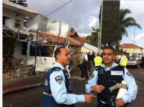
Gauche : Maison de Sderot frappée par un tir direct. Droite : Maison de Netivot après un tir direct le matin du 12 novembre