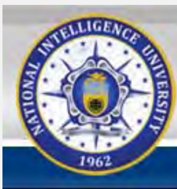
סמל אוניברסיטת המודיעין הלאומית האמריקנית

(ג) אחריות על ההוצאה לאור של האוניברסיטה.