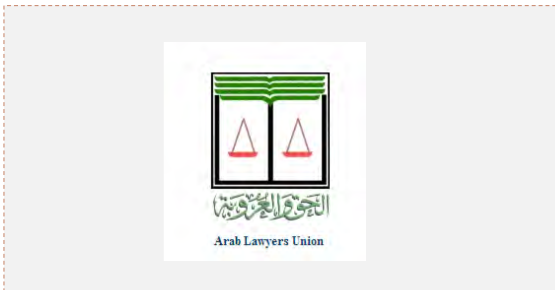
Logo de la Unión de Abogados Árabes.

1. La Unión de Abogados Árabes – Arab Lawyers Union – es una organización no gubernamental (ONG) que se creó en 1944. El cuartel general de la organización se encuentra en El Cairo, Egipto. La organización reúne en ella a abogados de 15 países árabes/musulmanes (Palestina es uno de ellos) y también a unas 27 organizaciones de la que son miembros más de 200.000 abogados. La organización tiene la categoría de cuerpo asesor en el Consejo Económico y Social de las Naciones Unidas y en la UNESCO. La organización también es miembro de la Unión de Abogados del Tribunal Internacional de Crímenes, miembro de la Federación Internacional de Abogados que está en Francia – UIA – y también de la Unión Internacional de Ayuda legal – ILAC.