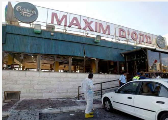
Escenario del atentado

5. El brazo militar de la Yihad Islámica en Palestina coronó a la terrorista con el nombre de “La novia de Haifa” diciendo que “el casamiento en Haifa le enseñaría a los sionistas una lección inolvidable”