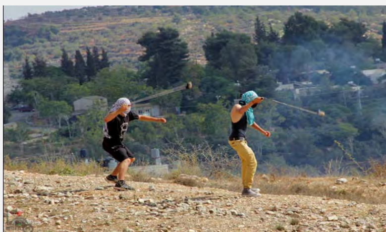
تظاهرات ضد اسرائیلی روز آدینه در روستای فلسطینی «نبی صالح» («وفا»، 12 اکتبر 2012)

■ در سراسر کرانه باختری رود اردن همانند هر هفته دیگر در مراکز درگیری همیشگی، تظاهراتی از سوی فلسطینی ها علیه اسرائیل برگزار گردید. تظاهر کنندگان، سنگ و بطری آتش زا به سوی نیروهای ارتش اسرائیل پرتاب کردند و در چند مورد، سربازان به وسائل ویژه عادی برای پراکنده ساختن تظاهرات متوسل شدند. همچنین در چند مورد به سوی خودروهای اسرائیلی و وسایط نقلیه امنیتی سنگ و بطری آتش زا پرتاب گردید.