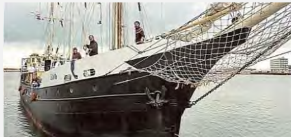
מימין: הספינה Estelle עוגנת באחד הנמלים. משמאל: קבלת פנים שנערכה לספינה בנמל נפולי שבאיטליה (אתר גדודי עז אלדין אלקסאם, 14 באוקטובר 2012)