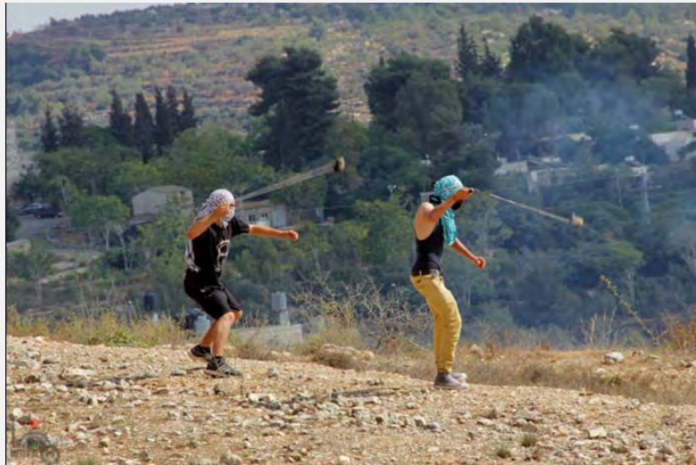
הפגנת יום שישי בנבי צאלח (ופא, 12 באוקטובר 2012)