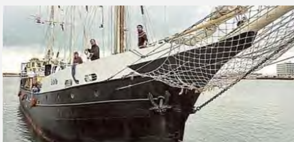
Droite : Le Estelle ancré dans l'un des ports. Gauche : Le navire accueilli à Naples