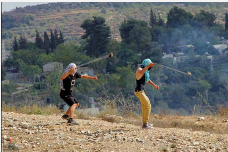
Manifestations du vendredi à Nabi Salah (Agence de presse Wafa, 12 octobre 2012)