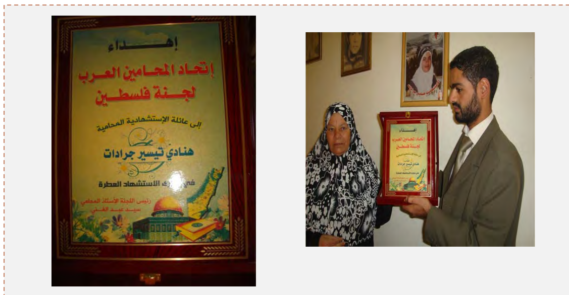
Droite : Un délégué de l'Union des avocats arabes remet une plaque à la famille de la terroriste Hinadi Jaradat à l'occasion du 8 ème anniversaire de sa mort. Gauche : La plaque reçue par la famille (Forum du Hamas, 13 octobre 2012)