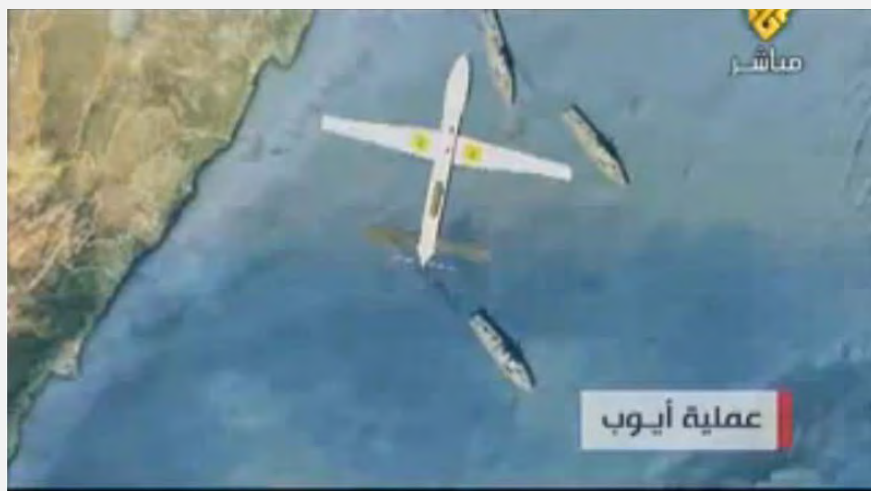
Film publié par le Hezbollah présentant l'envoi du drone en Israël dans le cadre de l'Opération Hussein Ayoub (Chaîne Al-Manar, Octobre 2012)