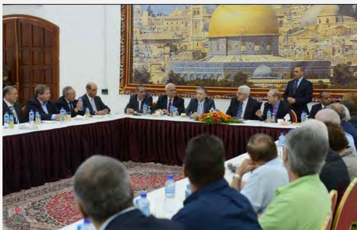
Mahmoud Abbas et les députés israéliens à Ramallah (, 14 octobre 2012)

■ Saeb Erekat, membre du comité exécutif de l'OLP, a déclaré que les Etats-Unis ne seraient pas en mesure d'empêcher la session de l'Assemblée générale des Nations Unies le mois prochain, où le vote sur l'adhésion palestinienne aura lieu. Il a dit que la décision permettrait à l'Autorité Palestinienne de reprendre les négociations , parce que la reconnaissance de la "Palestine" comme un Etat sous occupation servira de source d'autorité à la demande palestinienne qu'Israël se retire aux frontières de 1967, ainsi qu'à la reconnaissance de l'illégalité des implantations et l'annexion de Jérusalem (Radio Voix de la Palestine, 15 octobre 2012). Saeb Erekat a déclaré dans une interview que le fait de recevoir le statut d'Etat non-membre de l'ONU donnera accès à l'AP à la Cour internationale où les Palestiniens pourront poursuivre Israël (Agence de presse Ma'an, 13 octobre 2012).