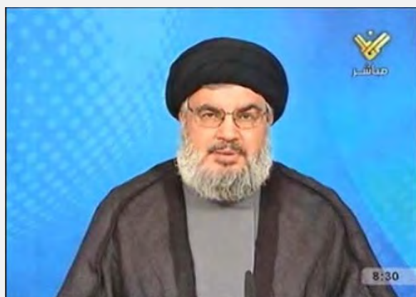
Hassan Nasrallah revendique l'envoi du drone (Chaîne Al-Manar, 11 octobre 2012)