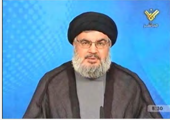
حسن نصر الله خلال الخطاب الذي أعلن خلاله المسؤولية عن إرسال الطائرة بدون طيار (قناة المنار، 11 تشرين الأول/أكتوبر 2012)