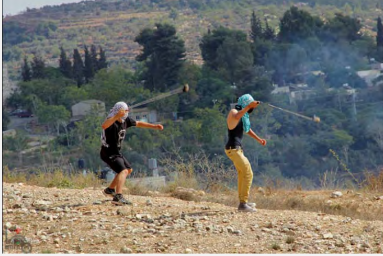
مظاهرة يوم الجمعة في النبي صالح (وفا، 12 تشرين الأول أكتوبر 2012)