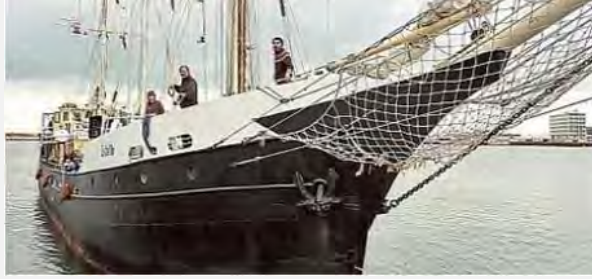
من اليمين: السفينة Estelle ترسو في أحد الموانئ. من اليسار: استقبال للسفينة في ميناء نابولي في إيطاليا (موقع كتائب عزّ الدين القسام، 14 تشرين الأول/أكتوبر 2012)