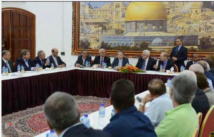
أبو مازن يلتقي أعضاء كنيسة إسرائيليين في رام الله (14 تشرين الأول\أكتوبر 2012)