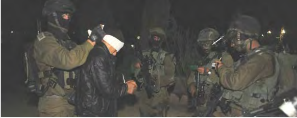
الفلسطينيان المعتقلان على أيدي قوات الجيش الإسرائيلي (الناطق بلسان الجيش الإسرائيلي، 8 تشرين الأول\أكتوبر 2012)

تم في 8 تشرين الأول\أكتوبر اعتقال فلسطينيين في مدخل إحدى القواعد العسكرية في الضفة الغربية. وقد وصل الاثنان إلى بوابة المعسكر وقالوا للجنود الذين كانوا يحرسون هناك إنهما يحملان عبوة ناسفة. وبعد فحص قصير وجد الجنود بحوزتهما عبوة ناسفة محلية الصنع. وتم تفجير العبوة عن بعد على يد خبراء المتفجرات. ومن التحقيق الأولي مع المعتقلين تبين أنهما وصلا من الخليل ولكن لم يعرف بعد ما إذا كانا ينتميان لأي تنظيم (الناطق بلسان الجيش الإسرائيلي، 8 تشرين الأول\أكتوبر 2012).