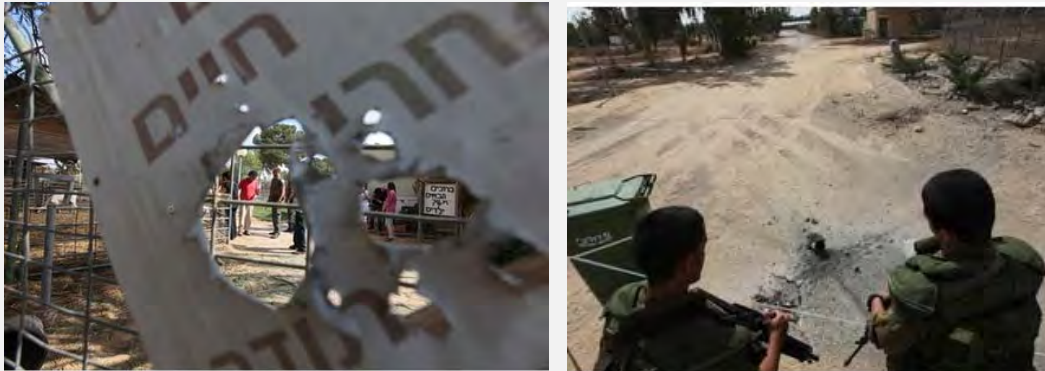
من اليمين: سقوط قذيفة هاون في مدخل إحدى البلدات التابعة للمجلس الإقليمي إشكول. من اليسار: إصابة حديقة الحيوانات الصغيرة في إحدى البلدات التابعة للمجلس الإقليمي إشكول (تحت رعاية NRG، 7 تشرين الأول/أكتوبر 2012 تصوير يهودا لحياتي)

■ تمّ منذ ساعات الصباح الباكر في 8 تشرين الأول/أكتوبر وفي أعقاب عملية الإحباط التي قام بها الجيش الإسرائيلي بإطلاق عدد كبير من قذائف الهاون باتجاه الأراضي الإسرائيلية. وسقط مجملًا في الأراضي الإسرائيلية صاروخ واحد وعشرات قذائف الهاون. سقطت معظمها في منطقة نفوذ المجلس الإقليمي إشكول. لم تقع إصابات ولكن لحقت أضرار لبعض البيوت ولحديقة صغيرة للحيوانات في إحدى البلدات (الناطق بلسان الجيش الإسرائيلي، 8 تشرين الأول/أكتوبر 2012).