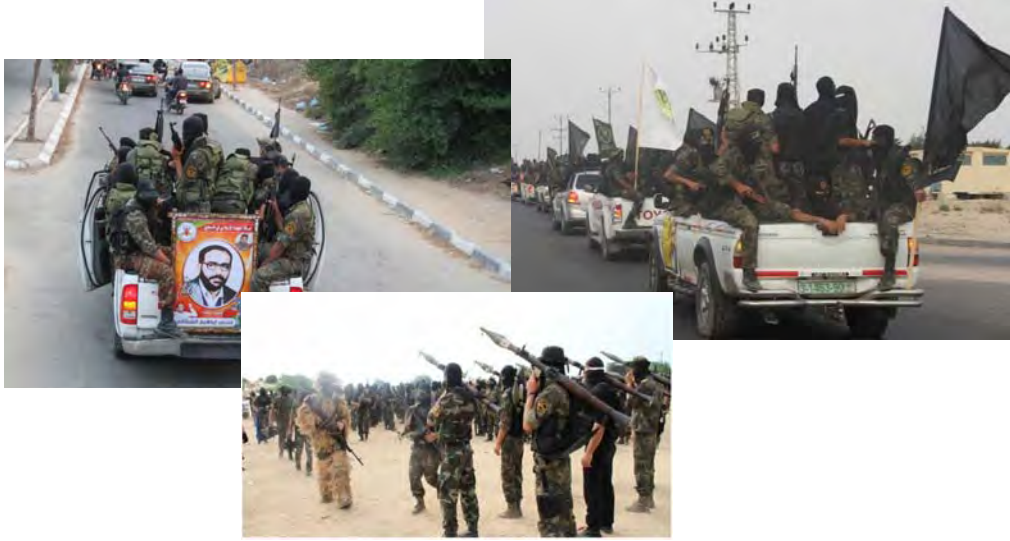
نشاط سربا القدس في مسيرة لأحياء ذكرى فتحي شكاكي (فال تودي، 2 تشرين الأول/أكتوبر 2012)