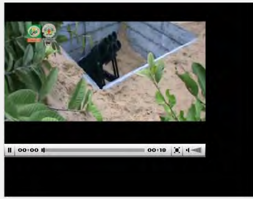
نشطاء حماس يطلقون الصواريخ باتجاه الأراضي الإسرائيلية (مأخوذ من أفلام قصيرة تمّ نشرها على موقع كتائب عزّ الدين القسام، 8 تشرين الأول\أكتوبر 2012)

■ وأغارت طائرات من سلاح الجوّ الإسرائيلي ردّاً على إطلاق النار المكثّف على خلايا إطلاق الصواريخ وقذائف الهاون، والتي كانت تهّم على إطلاقها باتجاه الأراضي الإسرائيلية متن قطاع غزة. كما هاجم الجيش الإسرائيلي عدّة أهداف إرهابية تابعة لحماس من بينها مبانٍ مدنيّة تستخدم لتخزين الوسائل القتاليّة (الناطق بلسان الجيش الإسرائيلي، 8 تشرين الأول\أكتوبر 2012). وأفادت وسائل الإعلام الفلسطينية أنّه وخلال غارات جويّة ضدّ مسجدين في خان يونس أصيب خمسة فلسطينيين (فلسطين أون لاين، وفا، صفا، 8 تشرين الأول\أكتوبر 2012).