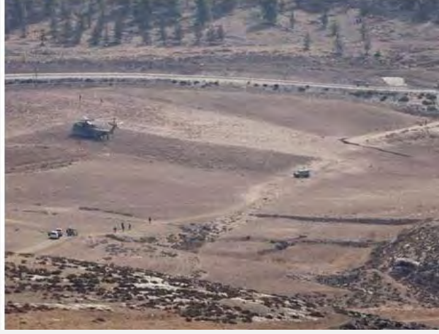
منطقة اعتراض الطائرة بدون طيار إلى الجنوب من جبل الخليل (تحت رعاية NRG, 6 تشرين الأول\أكتوبر 2012. تصوير يهودا لحياني)

■ ويتبين من التحقيق الأولي الذي أجرته الأجهزة الأمنية بحسب وسائل الإعلام الإسرائيلية، فإنّ الطائرة حلقت فوق البحر الأبيض المتوسط من الشمال إلى الجنوب خارج المياه الإقليمية الإسرائيلية. ونمّ توجيه الطائرة في منطقة قطاع غزة إلى الشرق ودخل الأراضي الإسرائيلية حتى تمّ اعتراضها في منطقة ياتير. وبحسب التقييمات فإنّ منظمة حزب الله مدعومة من إيران هي التي تقف كما يبدو وراء إطلاق الطائرة التي كانت في مهمة استخباراتية (NRG, 6 تشرين الأول\أكتوبر; هارتس, 7 تشرين الأول\أكتوبر).