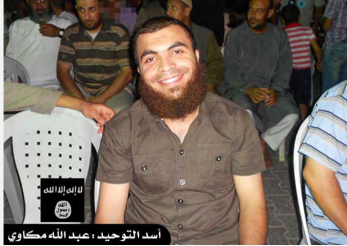
نشيط الجهاد العالمي عبد الله مكاوي (منتدى حماس، 8 تشرين الأول/أكتوبر 2012)