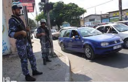
من اليمين: نشر قوات حماس في غزة. من اليسار: أبو عبيدة الجراح، رئيس جهاز الأمن القومي التابع لحكومة حماس، يتجول في شوارع غزة خلال التمرين (منتدى حماس، 6 تشرين الأول/أكتوبر 2012)