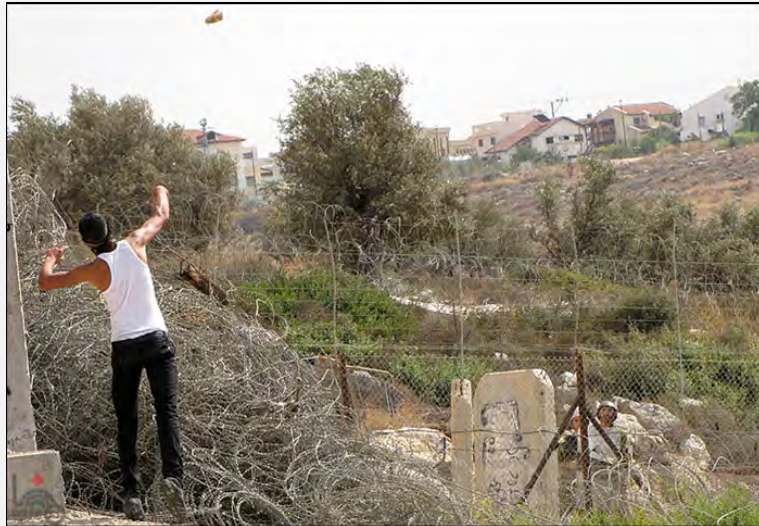
مظاهرة يوم الجمعة في نعلين (وفا، 5 تشرين الأول/أكتوبر 2012)

■ تم تنظيم مظاهرات في مواقع الاحتكاك التقليدية في أنحاء الضفة الغربية كما هو الحال في كل أسبوع. وألقى المتظاهرون الحجارة والزجاجات الحارقة باتجاه قوات الجيش الإسرائيلي التي ردت في بعض الحالات باستخدام وسائل لتفريق المظاهرات. ووقعت كذلك عدّة أحداث تمّ خلالها إلقاء الحجارة والزجاجات الحارقة باتجاه سيارات إسرائيلية وسيارات تابعة لقوات الأمن.