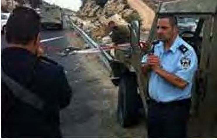
منطقة دهس الجنود (شرطة إسرائيل، المتحدث باسم لواء شاي في الشرطة، 2 تشرين الأول/أكتوبر 2012)