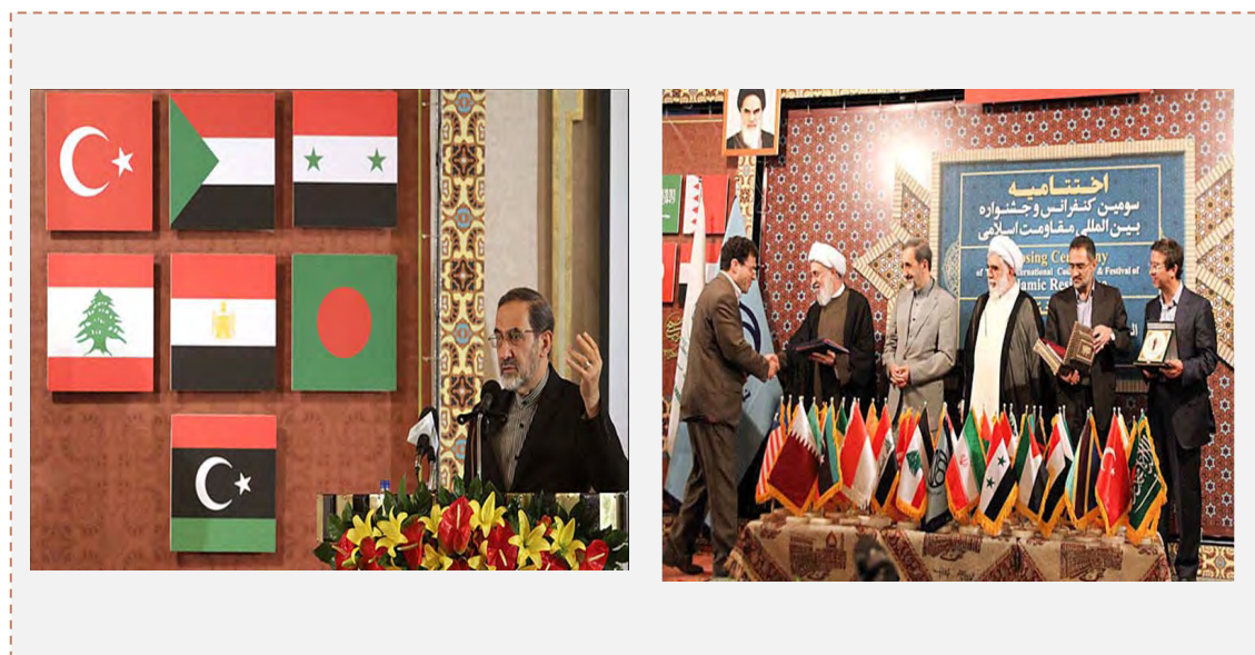
Фотографии, сделанные на третьей международной конференции по поддержке исламского сопротивления в иранском городе Исфахане (аль Антакад, 5 и 8 сентября 2012 года)