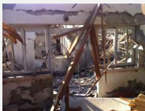
Два дома в городе Нетивот, разрушенных в результате прямого попадания ракеты (Даниэль Хаджиб, Sderot Media Center, 9 сентября 2012 года)