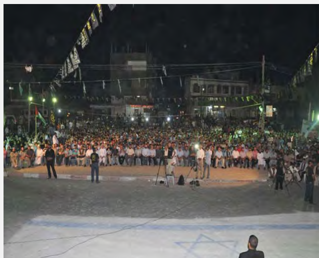
Боевики армейского крыла Исламского джихада в Палестине маршируют по флагу Израиля, нарисованному на шоссе (Ахбар Фалястин, 7 сентября 2012 года)

образом Ахмада аль Шейха Халиля 3 . В этом мероприятии участвовали руководители организации, семьи погибших боевиков и представители палестинских террористических организаций. Боевики армейского крыла организации устроили там военный парад и, маршируя, наступали на флаг Израиля (Ахбар Фалястин, 7 сентября 2012 года).