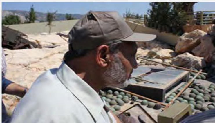
Махмуд аль Захар во время посещения мемориала Хезболлы в поселке Неватия, расположенном на юге Ливана (аль Антакад, 6 сентября 2012 года)

■ После посещения Ливана члены делегации отправились в Иран. В Иране аль Захар встретился с президентом страны Ахмадинежадом . Во время визита президент Ирана подчеркивал, что Иран поддерживает палестинцев (САФА, 9 сентября 2012 года). Аль Захар также встретился с Али Лориджани, председателем консультативного совета, который призывал "поднять голос сопротивления в регионе". Аль Захар говорил о том, что он высоко ценит Иран в связи с тем, что он поддерживает исламское "сопротивление" в Палестине: "Никто не может игнорировать важность Ирана и того места, которое он занимает в палестинском вопросе" (Аль Антакад, 6 сентября 2012 года).