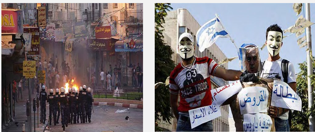
Справа: Демонстранты держат куклу, изображающую Саяма Фаяда, которую они вскоре подожгут вместе с флагом Израиля (Фалястин аль Ан, 5 сентября 2012 года). Слева: столкновение в Шхеме с палестинскими силами безопасности (Фалястин Аль ан, 11 сентября 2012 года)