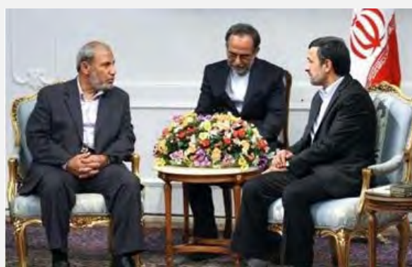
Встреча Махмуда аль Захара с президентом Ирана Ахмидениджадом (Аль Манар, 9 сентября 2012 г.)

■ После посещения Ливана члены делегации отправились в Иран. В Иране аль Захар встретился с президентом страны Ахмадинежадом . Во время визита президент Ирана подчеркивал, что Иран поддерживает палестинцев (САФА, 9 сентября 2012 года). Аль Захар также встретился с Али Лориджани, председателем консультативного совета, который призывал "поднять голос сопротивления в регионе". Аль Захар говорил о том, что он высоко ценит Иран в связи с тем, что он поддерживает исламское "сопротивление" в Палестине: "Никто не может игнорировать важность Ирана и того места, которое он занимает в палестинском вопросе" (Аль Антакад, 6 сентября 2012 года).