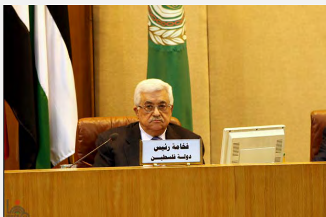
Абу Мазен на конференции арабской комиссии по наблюдению в Каире (ВАФА, 6 сентября 2012 года)