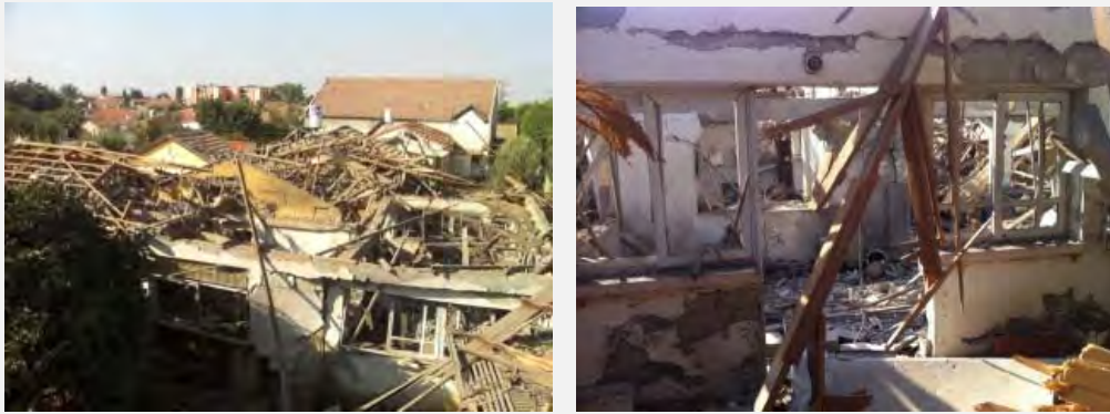
הרס שנגרם לשני בתי מגורים בעיר נתיבות כתוצאה מפגיעה ישירה של רקטה (דניאל חג'בי, Sderot Media Center, 9 בספטמבר 2012)