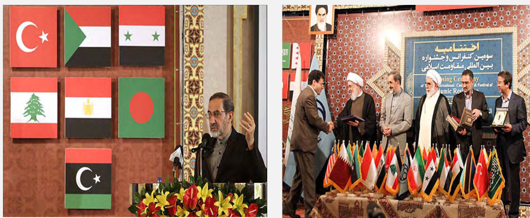
תמונות מהכנס הבינלאומי ה-3 לתמיכה בהתנגדות האסלאמית באצפהאן שבאירן (אלאנתקאד לבנון, 5 ו-8 בספטמבר 2012)