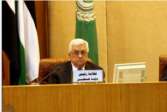
אבו מאזן בכינוס ועדת המעקב הערבית בקהיר (ופא, 6 בספטמבר 2012)