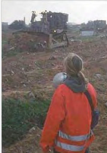
רייצ'ל קורי עומדת מול דחפור ישראלי