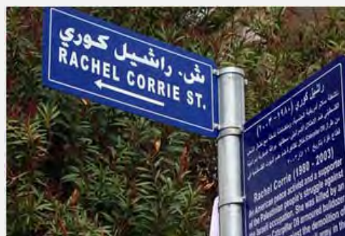
מחזה אודות רייצ'ל קורי שהוצג בתיאטרון בלונדון ב-2006 (ויקיפדיה)