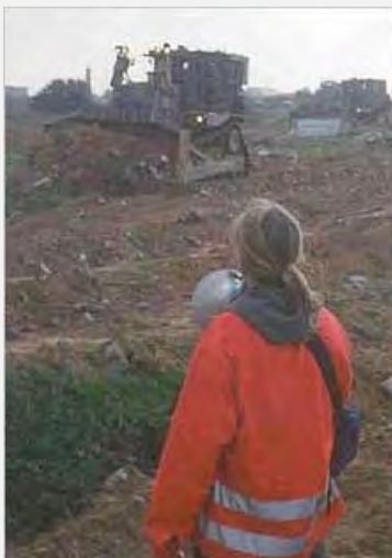
Rachel Corrie face à un bulldozer israélien