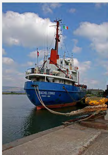
Navire baptisé au nom de Rachel Corrie, faisant route vers Gaza