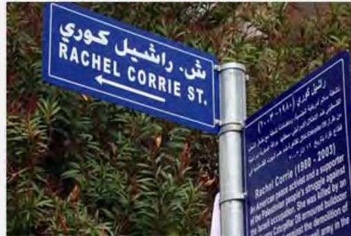
Rue Rachel Corrie à Ramallah