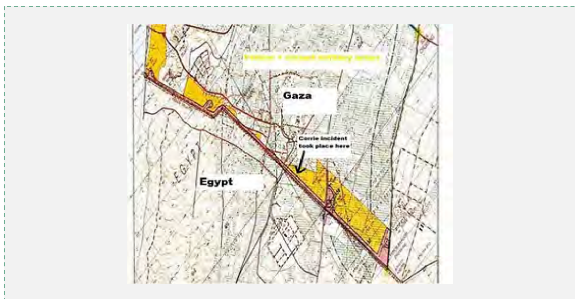
Site de l'incident dans lequel Rachel Corrie a été tuée (D'un article sur la reprise du procès de Rachel Corrie, israelseen.com, 9 septembre 2010)

8. Le 16 mars 2003, un groupe d'environ huit activistes du MSI, dont Rachel Corrie, a tenté de perturber le travail des bulldozers de Tsahal engagés dans le déblayage de terrain pour exposer des engins piégés et détruire des cachettes utilisées par des terroristes palestiniens. Le travail était effectué au Couloir Philadelphi, à environ 50 mètres de la frontière égyptienne (Voir la carte ci-dessous). La tactique utilisée était typique de celle employée par le MSI pour empêcher les forces de sécurité israéliennes d'effectuer des activités de contre-terrorisme, les activistes se comportant souvent d'une manière mettant en danger leurs vies et celles des soldats de Tsahal (comme noté dans la décision du juge de la Cour de Haïfa).