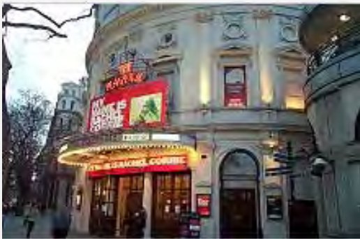
Pièce sur Rachel Corrie à un théâtre de Londres, 2006

1. L'activiste du MSI Rachel Corrie a été tuée le 16 mars 2003, en essayant d'empêcher les opérations d'un bulldozer nivelant le terrain près du Couloir Philadelphi, qui court le long de la frontière entre l'Égypte et Gaza. Corrie, citoyenne américaine, était active dans des causes sociales et politiques dans sa ville natale, Olympie, dans l'Etat de Washington. Après sa mort, elle est devenue un symbole pour les Palestiniens et les réseaux, organisations et activistes anti-israéliens de la campagne de délégitimation d'Israël.