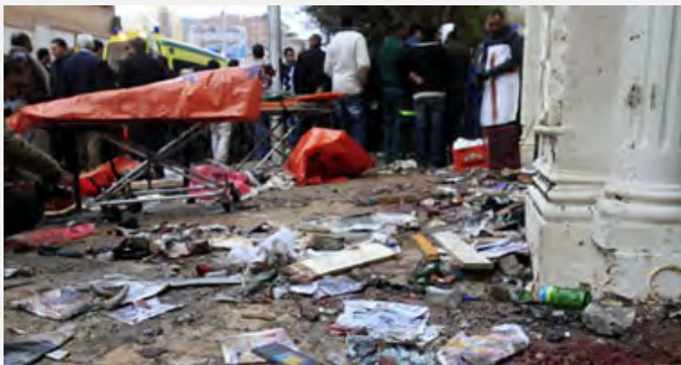
זירת הפיגוע בכנסייה הקופטית באלכסנדריה (האתר המצרי אליום אלסאבע, 3 בינואר 2011)