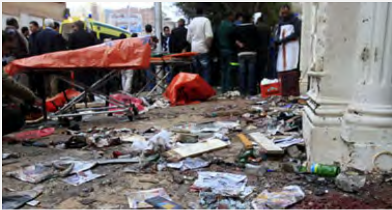
זירת הפיגוע בכנסייה הקופטית באלכסנדריה (האתר המצרי אליום אלסאבע, 3 בינואר 2011)