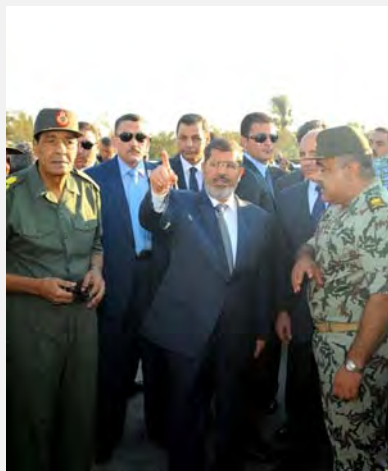
محمد مُرسی از العریش بازدید می کند

■ رییس جمهوری مصر سه روز عزاداری عمومی و برگزاری آیین رسمی و ملی برای خاکسپاری جان باختگان را اعلام کرد. همچنین شمار نیروهای امنیتی و نظامی مصر که در شبه جزیره سینای مستقر هستند، افزایش یافت. یک روز پس از حادثه، در روز ششم اوت، پرزیدنت محمد مُرسی خود همراه با وزیر دفاع، فیلد مارشال محمد حسین الطنطاوی و رییس ستاد کل ارتش مصر وارد العریش شد تا از یگان نگهبانی مرزی صدمه دیده بازدید کند و از نزدیک در جریان تحقیقات به عمل آمده قرار گیرد («الوفد»، ششم اوت 2012).