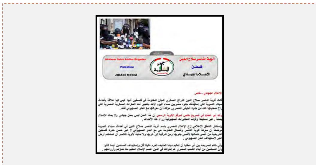
«کمیته های مقاومت مردمی» با انتشار بیانیه ای هرگونه دخالت در تعرض تروریستی در صحرای سینای را رد کردند (سامانه شاخه نظامی این کمیته ها، ششم اوت 2012)