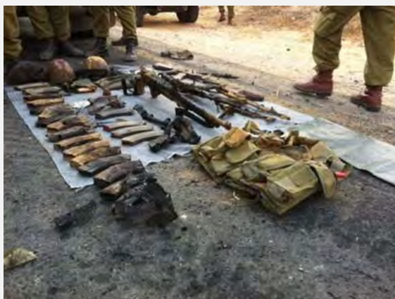
جنگ افزارهایی که در اختیار تروریست های هلاک شده قرار داشت (عکس از: سخنگوی ارتش اسرائیل، پنجم اوت 2012).

■ در واکنش، نیروهای ارتش اسرائیل به نفربرهای زرهی متعرض که در صدد رخنه به خاک اسرائیل بودند، پس از گذشت پانزده دقیقه مسلط شدند. در ساعت 20:15 شامگاه، یکی از نفربرها در نتیجه آتشباری سربازان اسرائیلی در مجاورت گذرگاه مرزی «کرم شالوم» منفجر شد. نفربر زرهی دوم که توانسته بود به داخل خاک اسرائیل رخنه کند نیز طی مدت کوتاهی پس از آن، توسط نیروهای زمینی ارتش و اشیاء پروازی ویژه نیروی هوایی اسرائیل هدف حمله قرار گرفت و آن نیز منهدم شد. دو مرد تروریست که از داخل نفربرها گریخته بودند، کوشیدند وارد خاک اسرائیل شوند ولی آنها نیز هدف آتشباری قرار گرفتند. چهار جسد از میان تروریست ها در بخش اسرائیلی یافت گردید که جنگ افزار و تجهیزات زیادی به همراه داشتند. سه جسد نیز در بخش مرزی مصر همراه با مقادیر چشم گیری مواد انفجاری در داخل نفربری که توانسته بود اندکی به خاک اسرائیل رخنه کند، به دست آمد. بر بدن شش نفر از میان هشت نفر تروریستی که به تعرض دست زده بودند، کمربندهای انفجاری بسته شده بود (سخنگوی ارتش اسرائیل و نیز تارنمای «وای. نت»، ynet، پنجم اوت 2012). در این دو حمله، دستکم شانزده نفر از نیروهای یگان دیده بانی مرزی مصر به دست تروریست ها به قتل رسیده و هفت نفر دیگر از گاردهای مرزی مصر زخمی شده بودند.