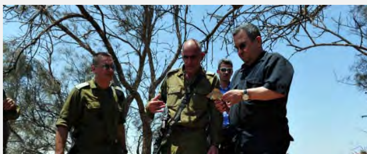
وزیر دفاع، اهود باراک، از محل توطئه تروریستی بازدید می کند (عکس از: سخنگوی وزارت دفاع اسرائیل، ششم اوت 2012)

■ رییس ستاد کل ارتش اسرائیل، ژنرال بنی گانتس، که خود ساعاتی پس از این رخداد برای بازدید از محل وقوع رویداد تروریستی رفته بود گفت با آنکه هنوز تحقیقات تکمیل نشده است اما می توان گفت که از یک فاجعه بزرگ علیه اسرائیل جلوگیری شده است، و نیز افزود: سرعت در ایجاد هماهنگی میان واحدهای مختلف نیروهای ارتش اسرائیل موجب شد که تنها ظرف پانزده دقیقه بتوان جلوی این تعرض تروریستی را گرفت (سخنگوی ارتش اسرائیل، ششم اوت 2012). وزیر دفاع اسرائیل آقای اهود باراک نیز که به هنگام بازدید از محل وقوع رویداد تروریستی همراه با نخست وزیر و رییس ستاد کل ارتش بود، تأکید کرد که برطرف شدن این توطئه به دلیل همکاری سریع و مفید میان تشکیلات اطلاعاتی و سرویسهای امنیتی و آمادگی ستاد فرماندهی میسر شد (سخنگوی ارتش اسرائیل، ششم اوت 2012).