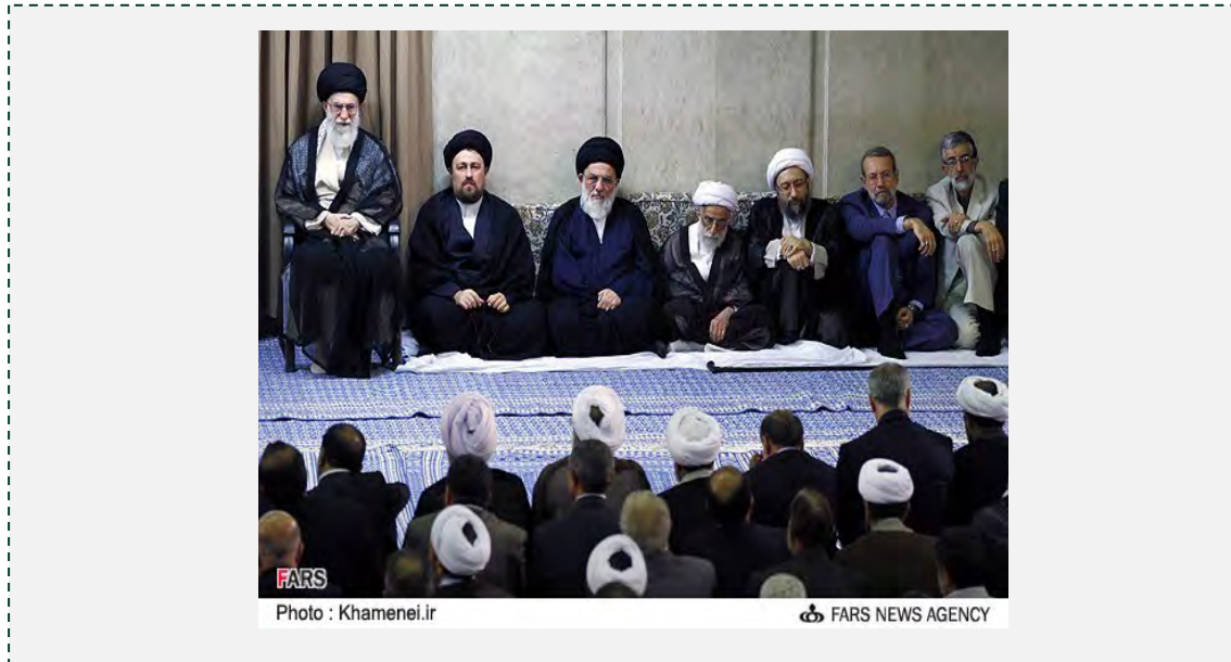
ח'אמנהאי בכנס בכירי המשטר בשבוע שעבר

בהמשך דבריו בכנס בכירי המשטר קרא ח'אמנהאי לאמץ "כלכלת התנגדות" לנוכח הסנקציות המוטלות על איראן. צריכה מתונה והימנעות מבזבז ומראוותנות הן בבחינת "תנועה ג'יהאדית" ועל הארגונים והאזרחים לנהוג בדרך זו. אדם שצורך בחסכנות ונמנע מראוותנות יכול לטעון, שהוא מיישם את הג'יהאד, אמר ח'אמנהאי (אתר המנהיג העליון, www.khamenei.ir , 24 יולי 2012).