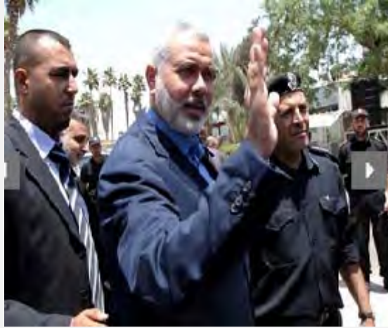
اسماعیل هنیه در گذرگاه الرفح در راه دیدار از مصر دیده می شود ( http://www.qassam.ps , 29 ژوئیه 2012)

درمان در این منطقه نیز که به گفته وی از کمبود دارو رنج می برد، خواهد داشت (خبرگزاری «صفا»، بیست و نهم ژوئیه 2012).