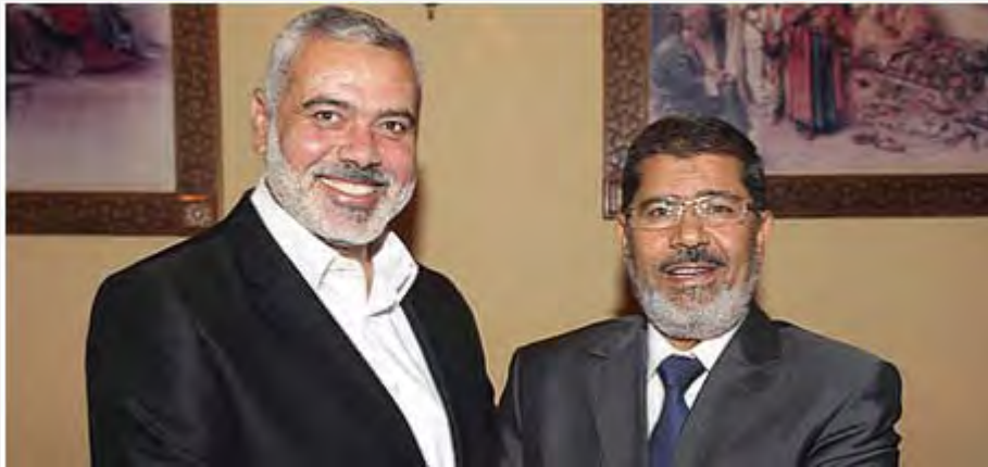
اسماعیل هنیه نخست وزیر حماس برای نخستین بار با محمد مُرسی رییس جمهوری مصر دیدار کرد (29 ژوئیه 2012 )