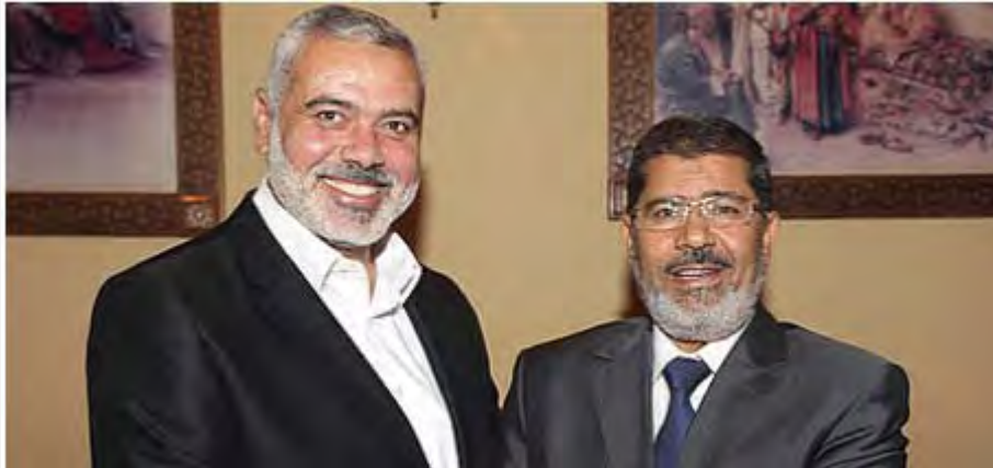
Ismail Haniya, le chef de l'administration de facto du Hamas, reçu par le Président égyptien Mohamed Morsi