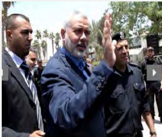
Ismail Haniya au terminal de Rafah en route pour l'Égypte ( http://www.qassam.ps , 29 juillet 2012)