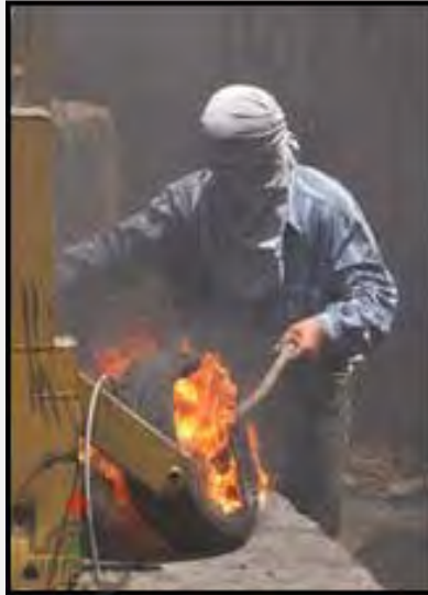
Un manifestante palestino pone fuego a un neumático durante la manifestación en Bil' in (WAFA, 13 de julio de 2012)