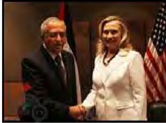
Saeb Erekat en su encuentro con Hilary Clinton (WAFA, 15 de julio de 2012)