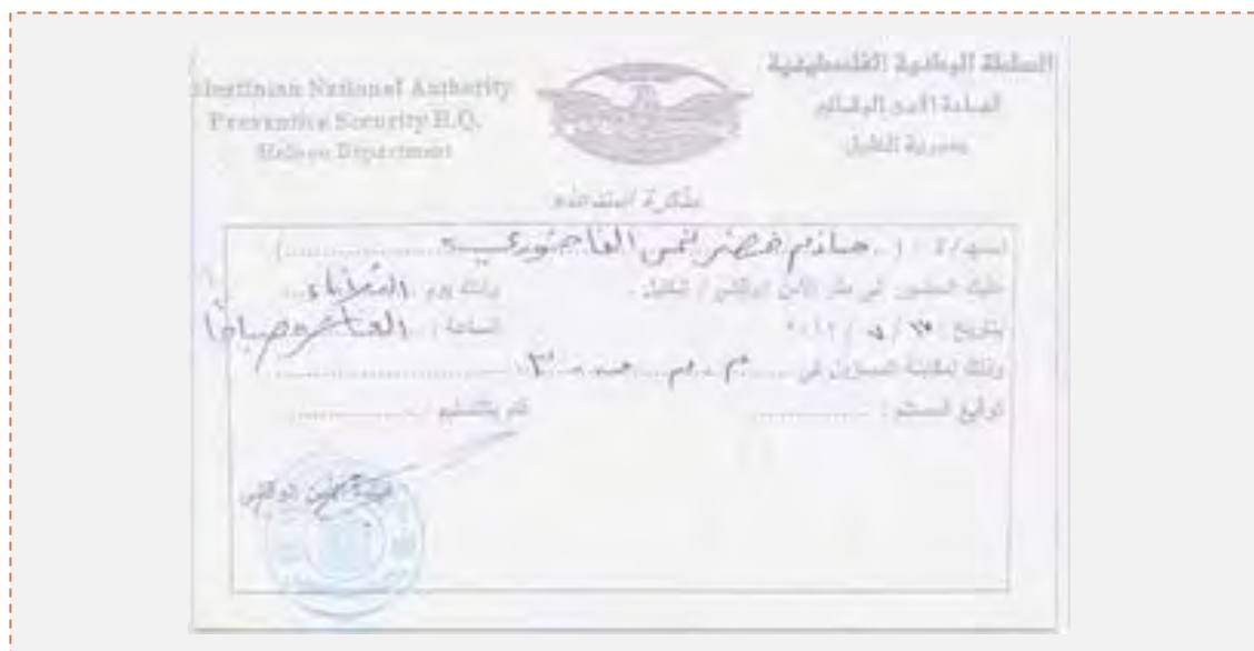
Orden de emitida por los mecanismo de seguridad de la Autoridad Palestina que llama a un activista de Hamás a presentarse ante las autoridades. (palestine-info 17 de julio de 2012)

■ Los mecanismos de seguridad de la Autoridad Palestina, liberaron a tres activistas de Hamás que estaban presos en la cárcel de Belén, y que habían hecho huelga de hambre. Según parece, su liberación fue conseguida por un acuerdo firmado entre el jefe de los clanes y personalidades públicas notables de Judea y los mecanismos de seguridad de Belén. Según el acuerdo, deberán liberarse más activistas de Hamás. (Palpares, Maan, 16 de julio de 2012)