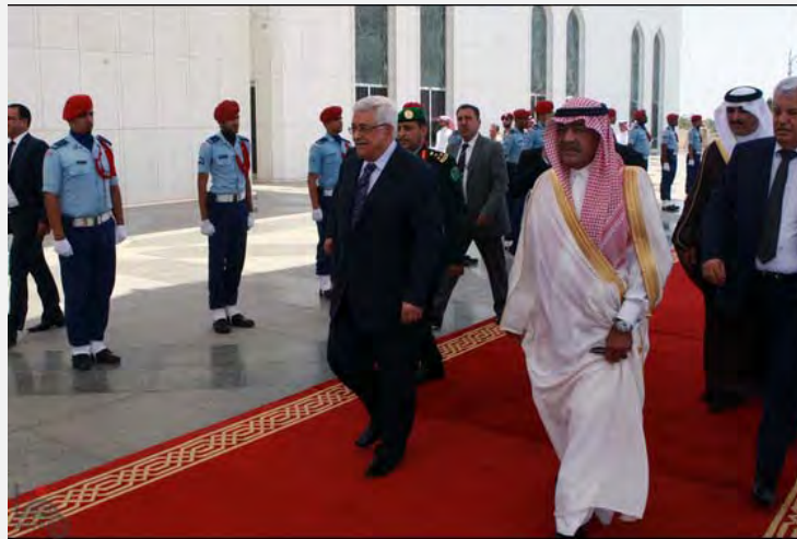
El presidente de la Autoridad Palestina, Abu Mazen, es recibido en Arabia Saudita con una ceremonia festiva (WAFA, 13 de julio de 2012)