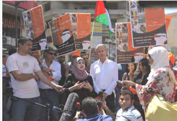
کمپین "بدر" ویژه تحریم فرآورده های اسرائیلی . چپ: برنامه ریزان کمپین شیر تولیدی اسرائیل را بر زمین می ریزند (وفا، پانزدهم ژوئیه 2012)