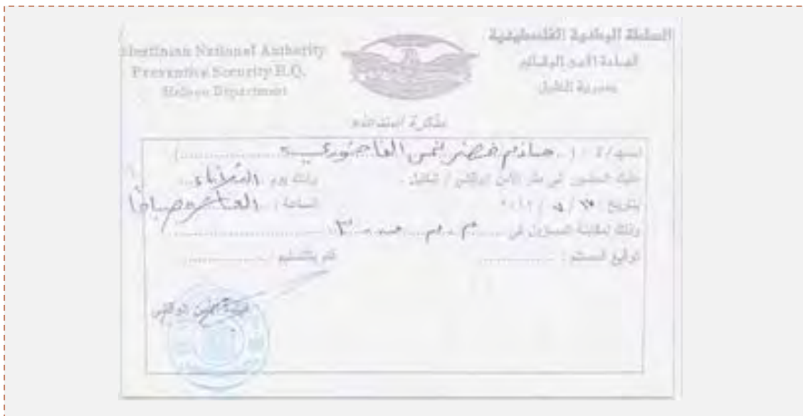
فراخوانی تشکیلات امنیتی حکومت خودگردان فلسطینی از یک فعال حماس در حبرون برای حاضر شدن جهت بازجویی (فلسطین اینفو، Palestine-info، هفدهم ژوئیه 2012)

■ تشکیلات امنیتی حکومت خودگردان فلسطینی سه تن از فعالان حماس را که در زندان بیت اللحم زندانی بودند و به اعتصاب غذا دست زده بودند آزاد کردند. آزادی این سه تن ظاهراً در پی توافقی که بین سران قبایل و محترمین شهر حبرون (الخلیل) و تشکیلات امنیتی در بیت اللحم به دست آمد، مسیر گردید. به موجب توافق قرار است گروه دیگری از فعالان حماس نیز آزاد شوند (پال پرس، معان، شانزدهم ژوئیه 2012).