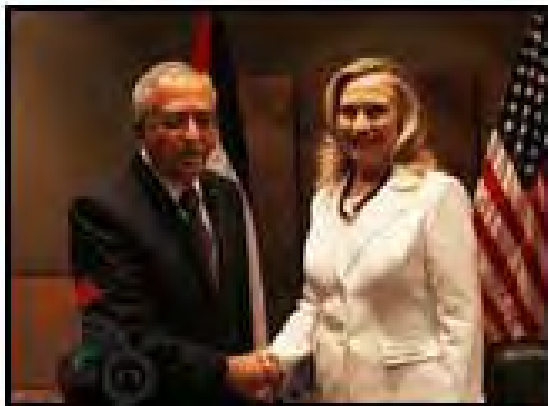
دیدار بین سلام فیاض و هیلاری کلینتون (صفا، پانزدهم ژوئیه 2012)

ساخت و ساز در آبادی های اسرائیلی نشین کرانه باختری رود اردن ادامه می دهد و به بازداشت فلسطینی ها ادامه میدهد. صائب عریقات خواهان توقف ساخت و ساز در آبادی های اسرائیلی آزادی زندانیان فلسطینی که پیش از امضای توافق صلح اوسلو زندانی شده بود و شناسایی کشور فلسطین در مرزهای سال 1967 شد (صوت فلسطین، پانزدهم ژوئیه 2012).