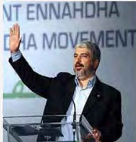
خالد مشعل در تونس سخنرانی کرد (فلسطین اینفو، Palestine-info دوازدهم ژوئیه 2012)

■ خالد مشعل از تونس عازم دیدار از مراکش شد.