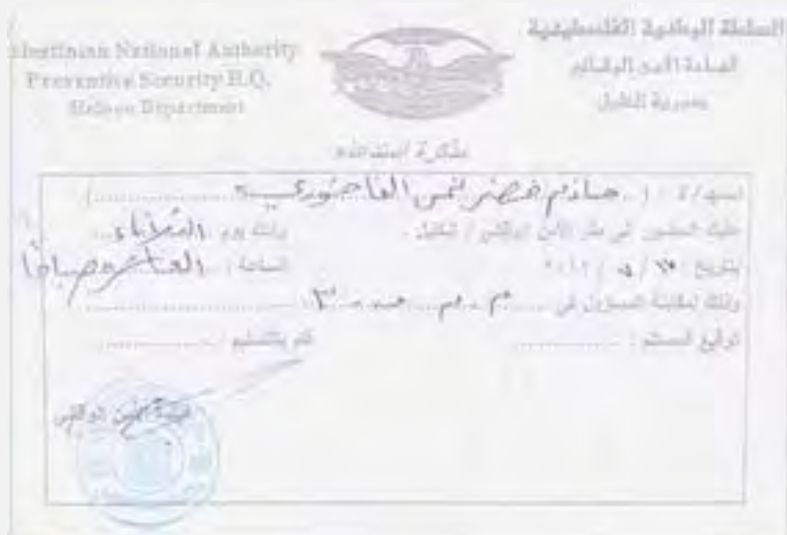
צו קריאה להתייבב לחקירה מטעם מנגנוני הביטחון של הרשות הפלסטינית, שהוצא לפעיל חמאס בחברון (Palestine-info, 17 ביולי 2012)

■ מנגנוני הביטחון של הרשות הפלסטינית שחררו שלושה פעילי חמאס, שהיו עצורים בבית הכלא בבית לחם, אשר שבתו שביתת רעב. שחרורם הושג, ככל הנראה, בעקבות הסכם שנחתם בין ראשי החמולות ונכבדי ציבור מחברון לבין מנגנון הביטחון בבית לחם. על פי ההסכם אמורים להשתחרר פעילי חמאס נוספים (פאלפרס, מען, 16 ביולי 2012).