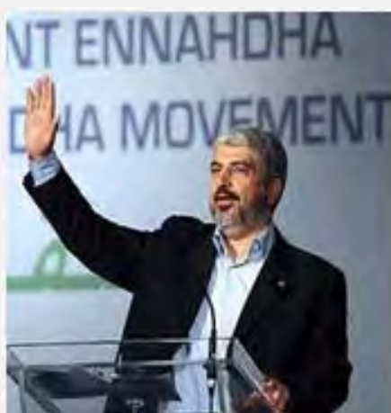
Khaled Mashaal à Tunis (Palestine-Info, 12 juillet 2012)