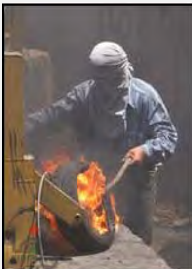
Incendie d'un pneu durant une manifestation à Bila'in (Wafa, 13 juillet 2012)

■ Comme chaque semaine, des manifestations ont été organisées au cours de la semaine écoulée aux points de friction habituels en Judée-Samarie, notamment dans les villages de Bila'in, Nili'in et Nebi Saleh. Les manifestants ont lancé des pierres sur les forces de Tsahal, qui ont riposté dans plusieurs cas par des mesures anti-émeute. Par ailleurs, à plusieurs occasions, des pierres et des cocktails Molotov ont été lancées sur des véhicules israéliens et des véhicules des forces de sécurité.