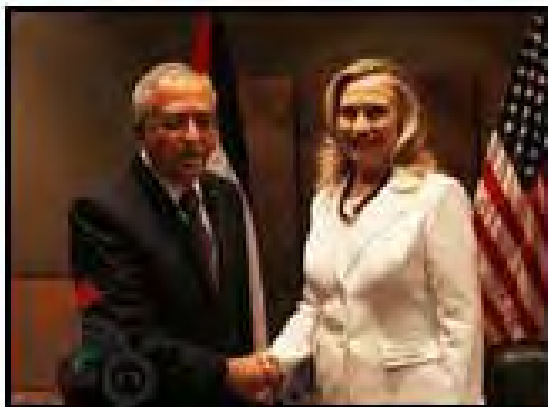
Rencontre entre Saeb Erekat et Hillary Clinton (Wafa, 15 juillet 2012)