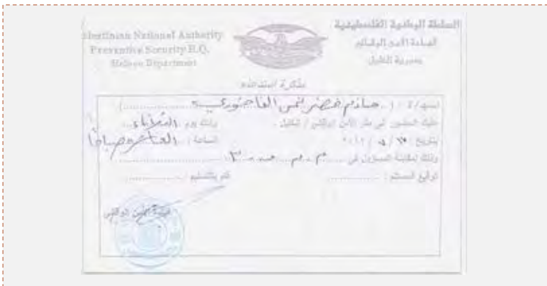
Citations à comparaître devant les services de sécurité de l'Autorité Palestiniens pour des activistes du Hamas de Hébron (Palestine-Info, 17 juillet 2012)

■ Les appareils sécuritaires de l'Autorité Palestinienne ont libéré trois activistes du Hamas qui avaient été emprisonnés dans la prison de Bethléem et avaient entamé une grève de la faim. Leur libération a apparemment été rendue possible par un accord signé entre les responsables des clans et des dignitaires de Hébron et les services de sécurité de Bethléem. Selon l'accord, d'autres activistes du Hamas devraient être libérés (PalPress, Ma'an, 16 juillet 2012).