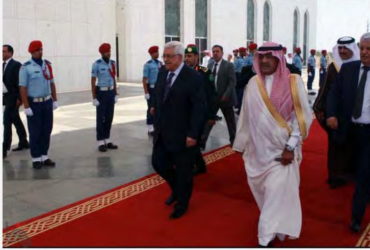
مراسم استقبال احتفالية لأبو مازن، رئيس السلطة الفلسطينية في السعودية (وفا، 13 تموز/يوليو 2012)