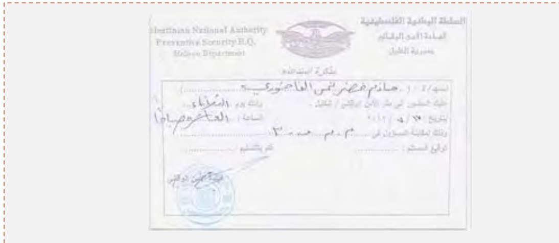
أمر بالامتثال إلى التحقيق من قبل أجهزة الأمن الفلسطينية والذي تمّ إصداره بحق نشيط حماسي في الخليل (Palestine-info, 17 تموز/يوليو 2012)

■ أفرجت أجهزة الأمن الفلسطينية عن ثلاثة نشطاء حماسيين كانوا معتقلين في سجن بيت لحم، والذين أُضربوا عن الطعام. وتمّ الإفراج عنهم كما يبدو بفضل التوصل إلى اتفاق تمّ توقيعه بين رؤساء الحماثل وشخصيات عامّة من الخليل وبين جهاز الأمن الفلسطيني في بيت لحم. وبحسب الاتفاق من المقرّر الإفراج عن نشطاء حماسيين آخرين (فال برس، معا، 16 تموز/يوليو 2012).