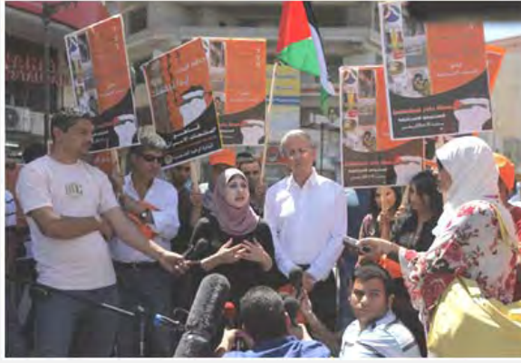
الدعاية الإعلامية "بادر" لمقاطعة المنتجات الإسرائيلية من اليسار: منظمو الدعاية الإعلامية يسكبون الحليب من إنتاج إسرائيل (وفا، 15 تموز/يوليو 2012)