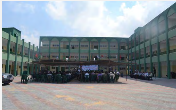
Escuela a nombre de Adnan al – Val en la Franja de Gaza (paldf, 8 de julio de 2012)