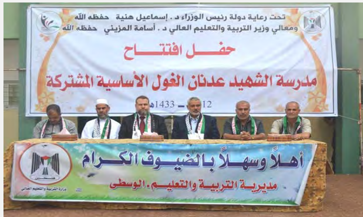
טקס חנוכת בית הספר על שם עדנאן אלע'ול ברצועת עזה במימון לוב ובחסות ראש ממשל חמאס, אסמאעיל הניה והאו"ם (ביולי 2012)

3. ב-8 ביולי נחנך ברצועת עזה בית-ספר יסודי חדש, שנקרא על שמו של עדנאן אלע'ול . בית-הספר נמצא סמוך לצומת נצרים לשעבר. בטקס חנוכת בית-הספר השתתפו אסמאעיל הניה , ראש ממשל חמאס ברצועה, ואסאמה אלמזיני , שר החינוך. בית הספר נבנה במימון ממשלת לוב ובוצע ע"י UNDP (United Nation Development Programme) בעזה, מוסד השייך לאו"ם העוסק בסיוע לפיתוח במדינות נזקקות 1 .