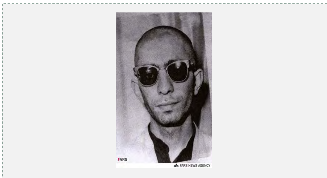
תמונת ח'אמנהאי המופיעה בביורפיה החדשה

עוד נטען באתר, כי חלק ממסמכי הסאואכ, שהובאו בספר, אינם אמינים וכי המנהיג העליון עצמו הכחיש בעבר חלק מהמידע הקשור בו ומופיע במסמכים אלה. גם חלק מהפרטים המופיעים בראיונות, שקיים מחבר הספר עם אישים שונים, אינם מדויקים (1) http://www.jahadi.ir/titr1/9104111 , יולי 2012).