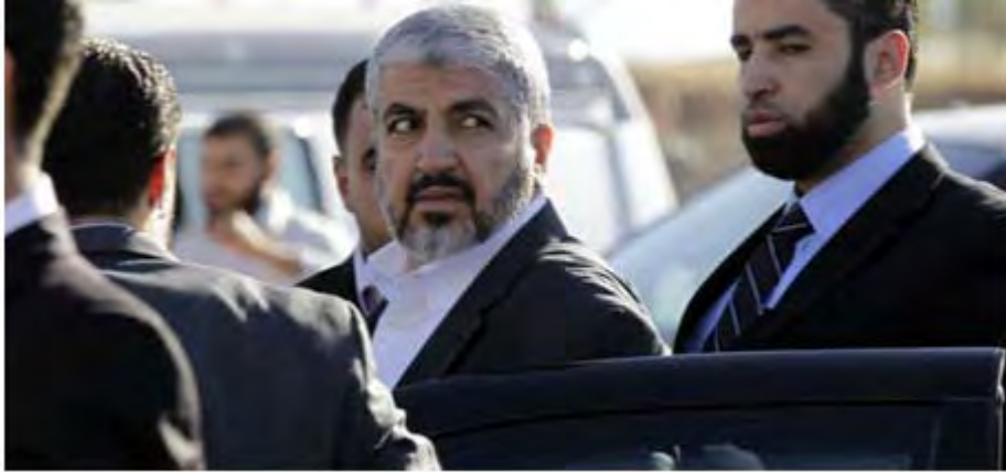
ח'אלד משעל בעת ביקורו בירדן (אתר גדודי עז אלדין אלקסאם, 3 ביולי 2012)