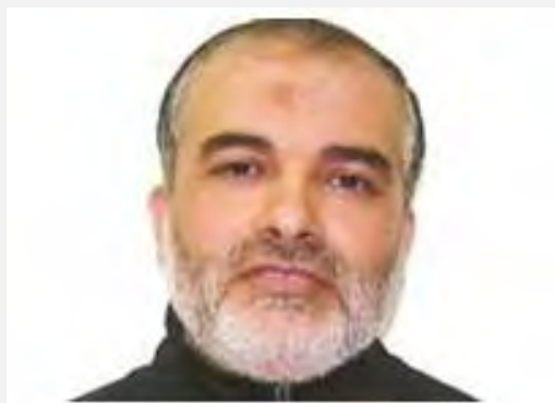
אבראהים חאמד (דובר צה"ל, 2 ביולי 2012)

■ הזרוע הצבאית של חמאס פרסמה הודעה מטעמה בה הבטיחה, כי גזר הדין יהיה "חסר ערך ולא יצא אל הפועל". היא הדגישה, כי אינה מכירה "בגזר הדין של הכיבוש" בהוסיפה, כשהעמדתם לדין של "לוחמי ג'האד" בידי ישראל באשמת "התנגדות" לכיבוש אינה חוקית מבחינה בינלאומית (אתר הזרוע הצבאית, 3 ביולי 2012)