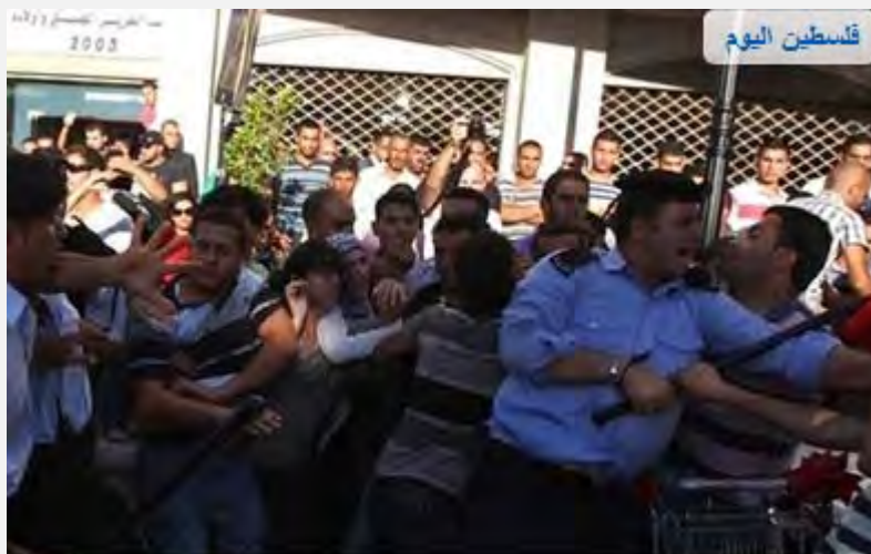
המשטרה הפלסטינית מדכאת הפגנות אלימות בראמאללה (Palestine-info, 2 ביולי 2012)