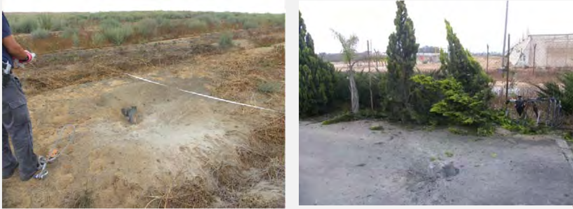
الصواريخ التي سقطت بالقرب من التجمعات السكنية في النقب الغربي (الناطقة بلسان المجلس الإقليمي إشكول، 22 حزيران ايونيو 2012)

■ وكان أوج إطلاق النار في 22 حزيران ايونيو حيث تم رصد سقوط 70 صاروخًا في النقب الغربي. وإجمالاً تم خلال أيام التصعيد رصد سقوط 162 صاروخًا (عدد مشابه من الصواريخ تم رصده في جولة التصعيد السابقة، في آذار امارس 2012). واعترضت منظومة القبة الحديدية بعض الصواريخ التي تم توجيهها بالتحديد إلى مدن سديروت ونيغوف وأشكولون. وتضررت بعض المباني نتيجة إطلاق الصواريخ بما في ذلك مدرسة في مدينة سديروت. وأصيب شخصان بجروح متوسطة وبعض الأشخاص الآخرين بجروح طفيفة والبعض الآخر أصيبوا بالهلع