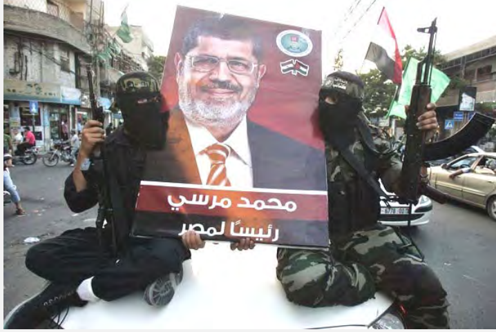
بواندر الفرحة في أوساط نشطاء الإرهاب الحمساويين في أعقاب فوز محمد مرسي (paldf, 25 حزيران/يونيو 2012)