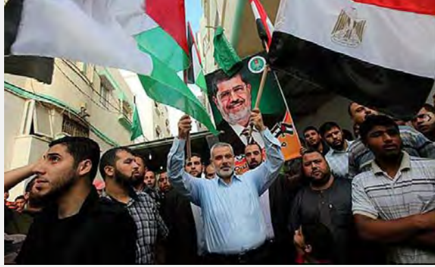
اسماعيل هنية يعرب عن فرحته في أعقاب انتخاب محمد مرسي رئيساً لمصر (Palestine-info, 25 حزيران/يونيو 2012)