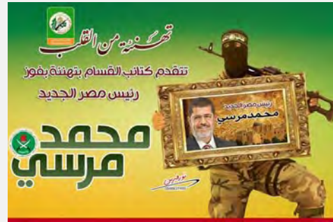
مظاهر الفرحة في أوساط نشطاء الإرهاب الحمساويين في أعقاب فوز محمد مرسي (paldf, 25 حزيران/يونيو 2012)