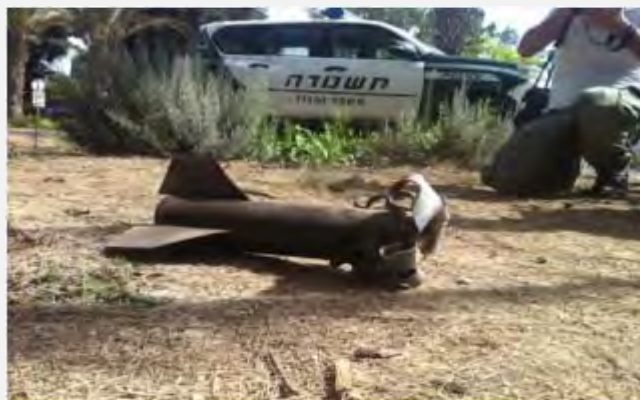
یک راکت که در یکی از آبادی های جنوب بر زمین افتاده است (عکس از: دانیل حجوی Sderot Media Center بیستم ژوئن 2012)