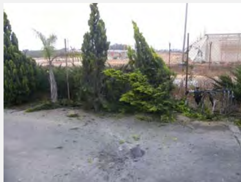
راکت هایی که در مجاورت آبادی های غرب نگب بر زمین افتاد (سختگویان شورای محلی اشکول، بیستم ژوئن 2012)