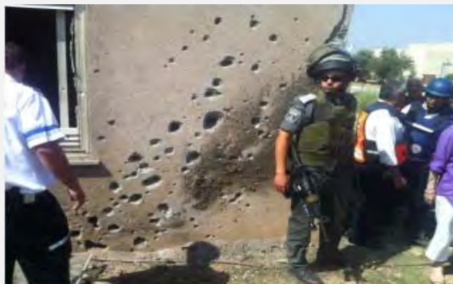
خانه یک شهروند اسرائیلی که بر اثر شلیک راکتی در یکی از آبادی های جنوب کشور صدمه دیده است (بیستم ژوئن 2012)