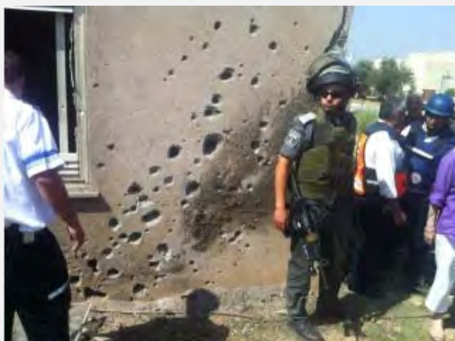
בית שניזוק באחד היישובים (דניאל חג'בי, Sderot Media Center 20 ביוני 20129)