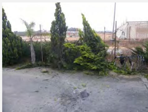
רקטות, שנפלו סמוך לישובים בנגב המערבי (דוברות המועצה האזורית אשכול, 20 ביוני 2012)