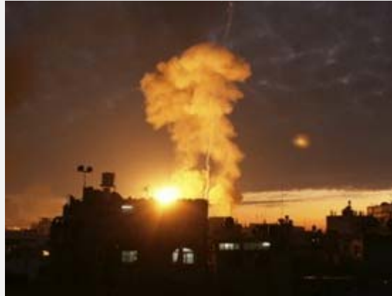
תקיפת חיל האוויר בצפון רצועת עזה (Palestine-info, 21 ביוני 2012)

20 ביוני 2012). כמו כן דווח על מותו של נער בן 14 ופציעתם של ארבעה מבני משפחתו כתוצאה מתקיפת חיל האוויר בשכונת אלזיתון בדרום העיר עזה (ופא, צפא, 20 ביוני 2012).