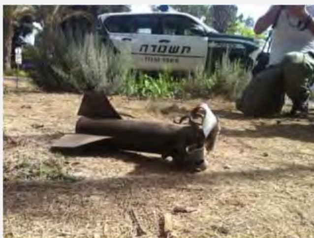
רקטה שנפלה באחד מיישובי הנגב (דניאל חג'בי, Sderot Media Center 20 ביוני 20129)