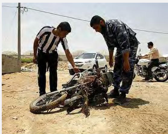
האופנוע שעליו רכב המחבל ברפיח (Palestine-info, 21 ביוני 2012)