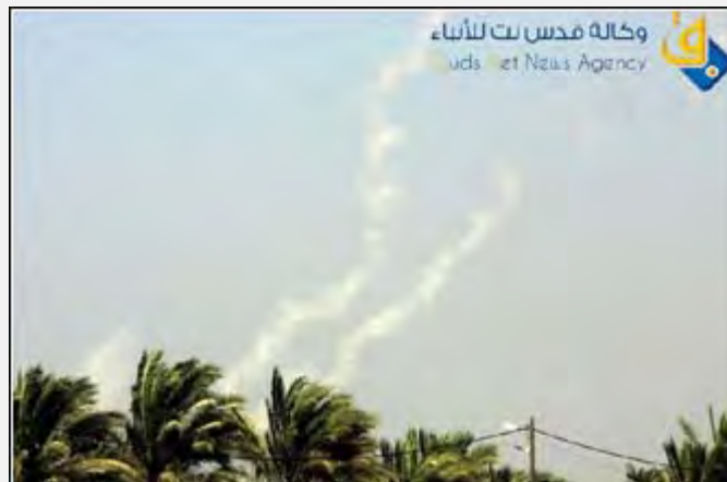
ירי רקטות מרצועת עזה (קדסנט, 20 ביוני 2012)

12. את מרבית הרקטות ירו פעילי הזרוע הצבאית של חמאס, גדודי עז אלדין אלקסאם, אשר לאחרונה נמנעה מלבצע ירי רקטות. בהודעות מטעם הזרוע הצבאית של חמאס, שקיבלו אחריות על הירי נאמר, כי הירי הוא בתגובה לתקיפות חיל האוויר ברצועת עזה, אשר בעקבותיהן נהרגו שישה פעילים. ברוב ההודעות של חמאס נמסר, כי הירי בוצע לעבר מוצבים של צה"ל (אתר גדודי עז אלדין אלקסאם, 19 ביוני 2012).