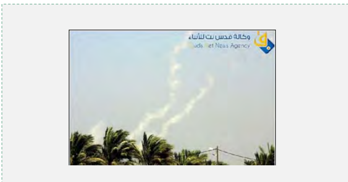
Tirs de roquettes de la bande de Gaza (Site Internet Qudsnet, 20 juin 2012)

12. Jusqu'ici, la plupart des roquettes ont été tirées par la branche armée du Hamas, les Brigades Izz al-Din al-Qassam, qui n'avait pas participé de manière significative aux tirs de roquettes l'année dernière . Les Brigades ont annoncé dans un communiqué revendiquant les tirs de roquettes que les attaques étaient une réaction aux frappes de l'armée de l'air israélienne dans la bande Gaza dans lesquelles six terroristes ont été tués . Dans la plupart de ses communiqués, le Hamas a affirmé que les roquettes avaient visé des positions de Tsahal (Site Internet des Brigades Izz al-Din al-Qassam, 19 juin 2012).