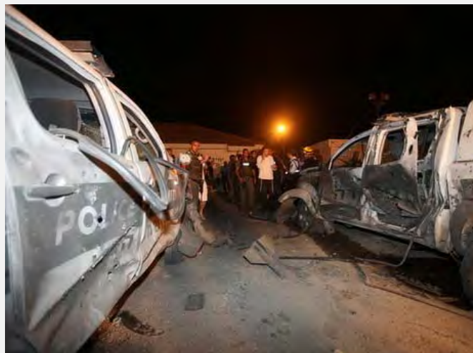
La roquette qui s'est abattue entre deux véhicules près d'Ashqelon, blessant 11 gardes-frontières, dont un gravement (Photo Yehuda Lahiani, NRG, 19 juin 2012)