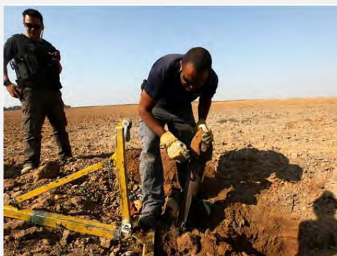
Les roquettes qui se sont abattues dans le Néguev occidental (19 juin 2012)