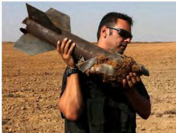
Une des roquettes découvertes dans le conseil régional d'Eshkol (19 juin 2012)

2) 19 juin : Quarante-deux impacts de roquettes ont été identifiés. La plupart des engins se sont abattus dans des terrains vagues. Trois ont été identifiés dans la ville de Netivot. Dans la soirée, une roquette s'est abattue au Sud d'Ashqelon, atterrissant à quelques centaines de mètres d'une équipe de démineurs de la police. Un autre engin a frappé un champ de blé, y mettant le feu.