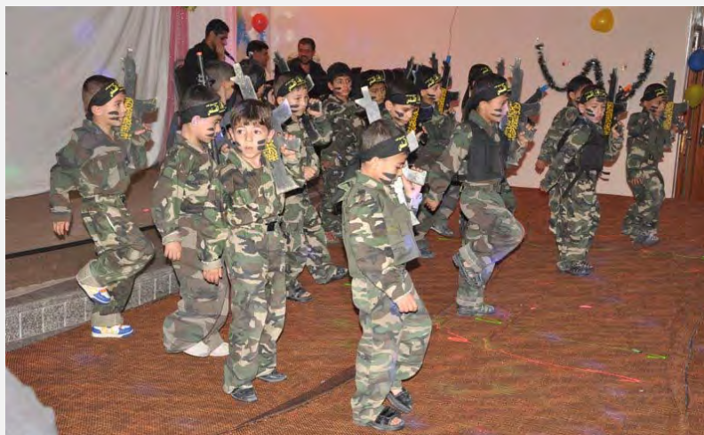
Спектакль, показанный на выпускном утреннике в детском саду в Газе, работающем под эгидой Исламского джихада в Палестине (paldf, 11 июня 2012 года)