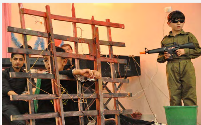
d. Entraînement d'enfants revêtus d'uniformes