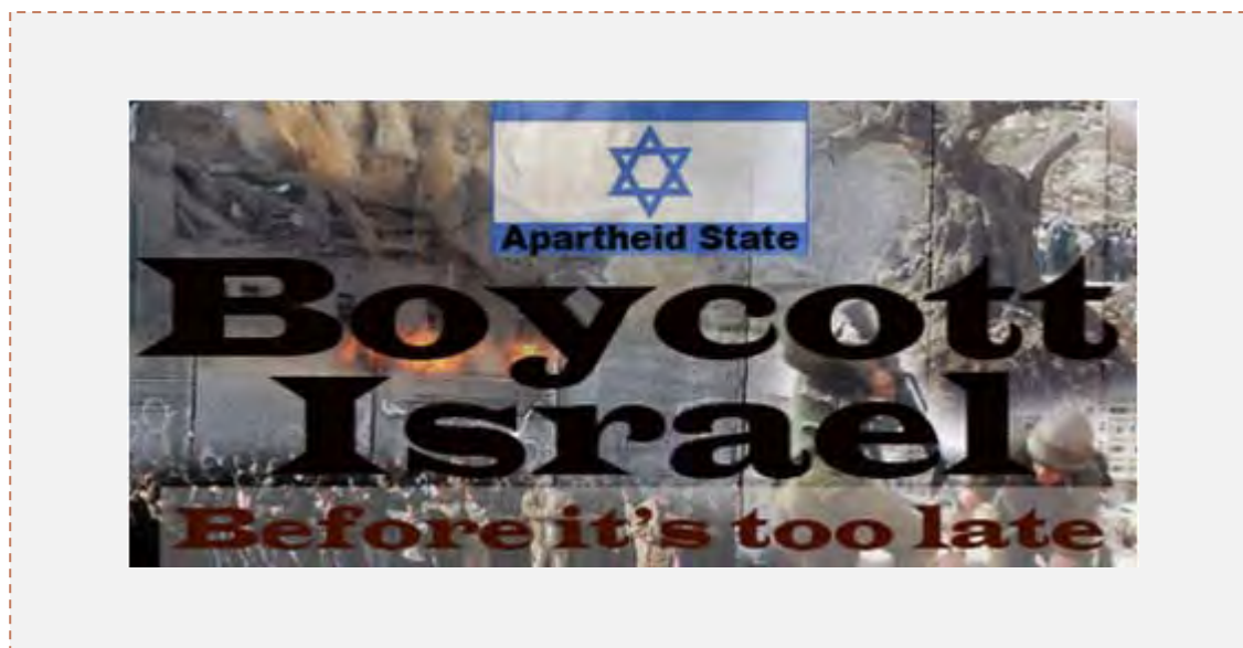
Afiche de la campaña europea contra los asentamientos (sitio de las Brigadas Azz-A-Din Al-Qassam, 11 de junio de 2012)