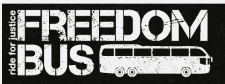
Emblema de la iniciativa del "autobús de la libertad" (Sitio del Teatro de la libertad, 12 de junio de 2012)