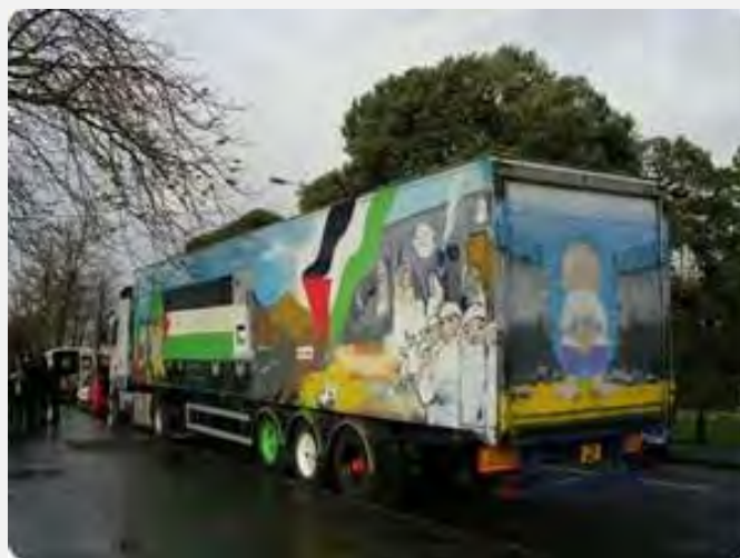
El convoy "Miles of Smiles 13" hace su entrada en la Franja de Gaza (Palestine.info, 11 de junio de 2012)

con el jefe del gobierno de Hamás Ismail Haniya que les dio la bienvenida (Safa, 11 de junio de 2012).