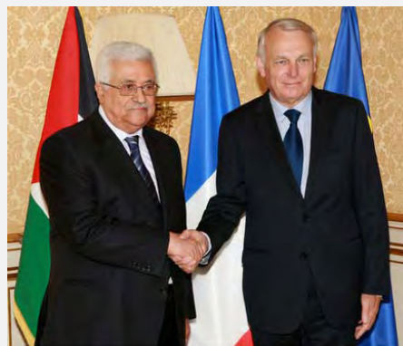
A la izquierda: Mahmoud Abbas con el canciller francés. A la derecha: reunión con el Primer Ministro de Francia (Wafa, 8 de junio de 2012)