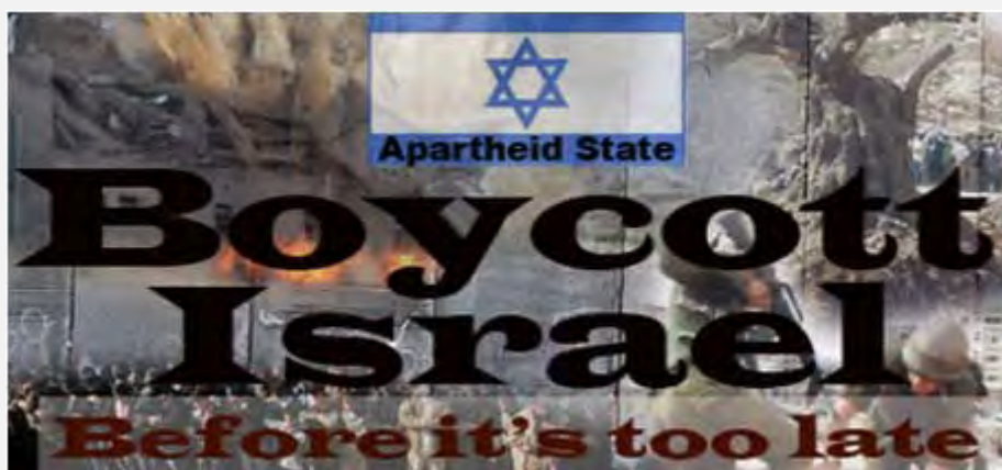
Affiche de la campagne européenne contre les implantations (Site Internet des Brigades Izz al-Din al-Qassam, 11 juin 2012)