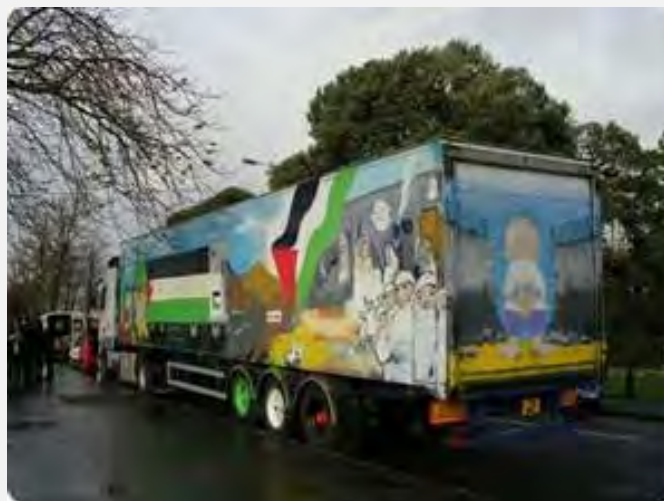
Arrivée du convoi "Miles of Smiles 13" dans la bande de Gaza (Palestine-Info, 11 juin 2012)

de Gaza, la délégation jordanienne a rencontré le guide général des Frères Musulmans au Caire (Chaîne Al-Aqsa, 10 juin 2012). A Gaza, les membres du convoi ont rencontré Ismail Haniya, le responsable de l'administration de facto du Hamas qui a salué leur arrivée (Agence de presse Safa, 11 juin 2012).