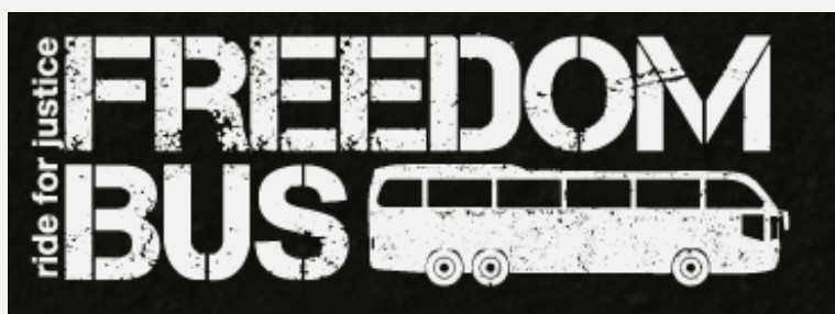
Logo de l'initiative "Freedom Bus"