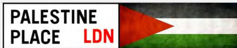
Logo du congrès de Londres (Site Internet de la conférence, 9 juin 2012)