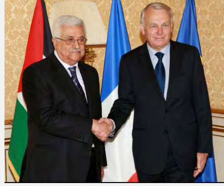
من اليمين: أبو مازن مع رئيس الحكومة الفرنسية. من اليسار: لقاء مع وزير الخارجية الفرنسي (وفا، 8 حزيران/يونيو 2012).