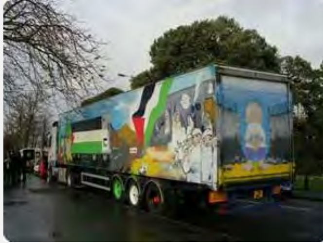
قافلة "أميال من الابتسامات 13" تدخل إلى قطاع غزة (Palestine –info 11 حزيران/يونيو 2012)

■ وصلت قافلة المساعدات التي تحمل اسم "أميال من الابتسامات 13" إلى قطاع غزة في 10 حزيران/يونيو عن طريق معبر رفح. وتضمّ القافلة 119 نشطاء من 17 دولة خصوصاً إسلامية. ومن ضمن نشطاء القافلة بعثة أردنية كبيرة برئاسة همام سعيد، المفتش العامّ لحركة الاخوان المسلمين في الأردن. وقبيل دخولها إلى قطاع غزة، التقت البعثة الاردنية في القاهرة مع المرشد العامّ لحركة الاخوان المسلمين في مصر (قناة الأقصى، 10 حزيران/يونيو 2012). والتقى أعضاء القافلة في غزة بإسماعيل هنية، رئيس حكومة حماس، والذي هنأ بقدم القافلة (صفا، 11 حزيران/يونيو 2012).