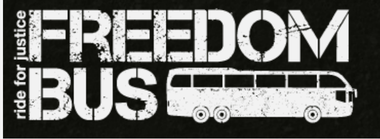
شعار مبادرة الجولة في الباص (موقع الانترنت التابع لمسرح الحرية، 12 حزيران/يونيو 2012)

قصص اعضاءه الشخصية. ومن بين داعمي المبادرة نشطاء BDS ونشطاء من منظمة ISM - Free Gaza Movement (وهما منظمتان بارزتان في محاولات نزع الشرعية عن إسرائيل).