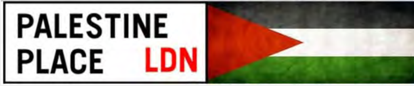
شعار المؤتمر في لندن