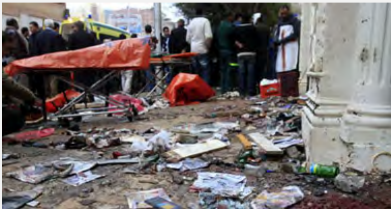
זירת הפיגוע בכנסייה הקופטית באלכסנדריה (האתר המצרי אליום אלסאבע, 3 בינואר 2011)

א. 1 בינואר 2011 - חביב אלעדאלי, שר הפנים המצרי, האשים את צבא האסלאם, בביצוע הפיגוע בכנסייה הקופטית באלכסנדריה בליל השנה החדשה (1 בינואר 2011). בפיגוע זה נהרגו 25 אזרחים ועשרות נוספים נפצעו . בהזדמנות זאת האשימה התקשורת המצרית את צבא האסלאם במעורבות במספר פיגועי טרור נוספים, שאירעו על אדמת מצרים בשנים האחרונות. שר הפנים טען, כי המידע על כך הגיע בעקבות מעצרו של פעיל אלקאעדה מצרי בשם אחמד לטפי אבראהים, שהיה מעורב בפיגוע בכנסייה הקופטית ועמד בקשר עם חוליית אלקאעדה, שנחשפה עוד לפני הפיגוע באלכסנדריה. בחקירתו הוא חשף את מעורבותו בפיגועי טרור במצרים ואת קשריו עם צבא האסלאם ברצועה. בתגובה מסר אבו ח'טאב, בכיר בארגון צבא האסלאם, כי ארגונו אינו פועל בשטח מצרים וטען כי מדובר ב"מזימה" של ישראל, שנועדה לגייס תמיכה במלחמה חדשה נגד עזה (טלוויזיה מצרית, 23 בינואר 2011; אלרסאלה, 23 בינואר 2011).