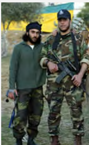
ממתאז דע'מש, מקים צבא האסלאם ומי שעומד בראשו (מימין), עם אחד מאנשיו (פורום חמאס, 24 בינואר 2007)

12. צבא האסלאם נחשב כיום כארגון הדומיננטי מבין ההתארגנויות המזוהות עם אלקאעדה והג'האד העולמי ברצועה. שני פעילי צבא האסלאם, נטלו חלק בפיגוע בכרם שלום (יוני 2006) בו נחטף גלעד שליט ואז גם פורסם שמו לראשונה בפומבי. מאז תום מבצע "עופרת יצוקה" ניסה הארגון לבצע פיגועים נגד יעדים ישראלים וזרים בדגש על ישראלים השוהים בחצי האי סיני. בשנים האחרונות אימץ לעצמו צבא האסלאם מאפייני פעילות בולטים של ארגוני הג'האד העולמי כמו חטיפת עיתונאים מערביים ופגיעה במקומות בילוי בעלי אופי מערבי (בתי קפה אינטרנט) ברצועת עזה.