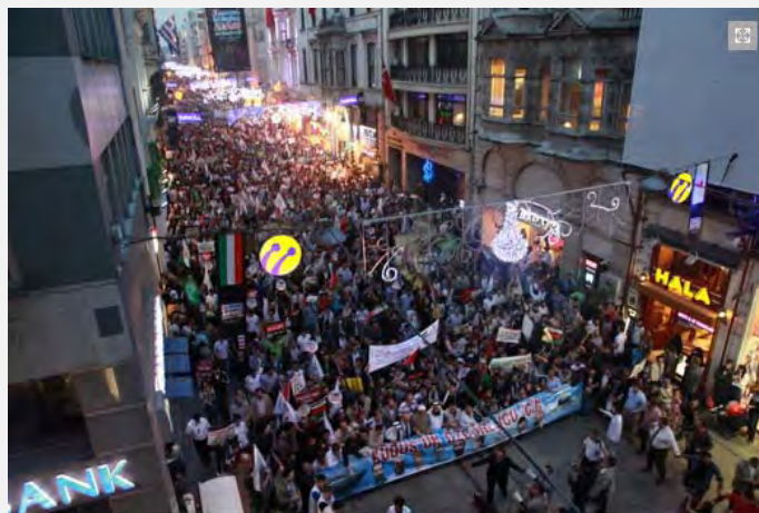
Шествие на церемониальной площади (интернет-сайт организации ИНН, 3 июня 2012 г.)

■ 31 мая в Стамбуле была проведена серия мероприятий, посвященных второй годовщине событий на "Мави Мармара". Центральным событием этого дня стало шествие, состоявшееся на церемониальной площади в центре Стамбула. По сообщению сайта организации ИНН, в шествии приняли участие около 30 тысяч человек. Демонстранты несли плакаты, посвященные памяти погибших и солидарности с палестинцами, а также плакаты, осуждающие президента Сирии Башара Асада.