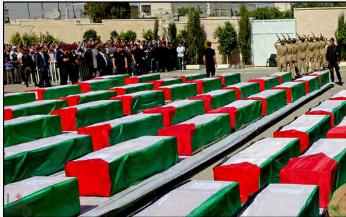
Гробы с телами погибших террористов на площади Муктаа в Рамалле (агентство ВАФА, 31 мая 2012 г.)

■ Иса аль Карак , министр по делам заключенных Палестинской автономии, сообщил, что тела террористов будут похоронены в местах, где они жили. Во время похорон состоятся церемонии, организованные правительством Палестинской автономии, на которых будут присутствовать губернаторы и представители местных властей (Аль Хаят Аль Джадида, 31 мая 2012 г.). В Палестинской автономии и в администрации Хамаса состоялись правительственные и армейские церемонии, посвященные передаче трупов. В Рамалле, на площади Муктаа, состоялась официальная церемония с участием Абу Мазена и других членов палестинского руководства, а также членов семей погибших (агентство ВАФА, 31 мая 2012 года).