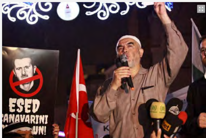
شیخ راید صلاح در مراسم استانبول سخنرانی می کند (وبسایت IHH ، سوم ژوئن 2012)