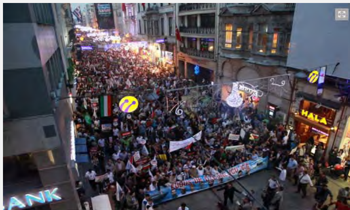
راهپیمایی در میدان «تقسیم» در استانبول ترکیه

■ در سخنرانی که رییس سازمان IHH، بولنت یلدریم، در این آیین در استانبول ایراد کرد، وی به موضوع کیفرخواست صادره از سوی دادستانی استانبول ترکیه علیه مقامات نظامی پیشین اسرائیل نیز اشاره کرد 3 . بولنت یلدریم گفت که هدف، تنها محاکمه کردن چهار تن از مقامات نظامی پیشین اسرائیل نیست و به باور سازمان وی، هر عاملی که از سوی اسرائیل در این رویداد دخیل بوده است، باید محاکمه شود، و نیز تأکید کرد که «مبارزه علیه این افراد مجرم هر چند سال که لازم باشد، ادامه خواهد یافت».