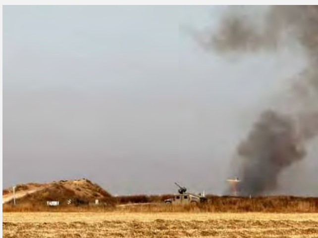
محل برخورد با تروریست در مجاورت «کیسوفیم» در مرکز نوار غزه (NRG، اول ژوئن 2012. عکاس: یهودا لحيانی)

■ بررسی و تحقیقات نظامی که در مورد این رویداد انجام گرفت، نشان داد که فرد تروریست از جدار حایل گذشته و وارد خاک اسرائیل شده و در آنجا از پشت یک پناهگاه به کمین نشسته بود تا نیروهای اسرائیل به آنجا بیایند. فرد تروریست نیروی ارتش اسرائیل را با آتشباری به سوی آنان غافلگیر ساخت و در نتیجه سرباز اسرائیلی کشته شد. سایر سربازان اسرائیلی نیز به سوی تروریست آتش گشودند و او را کشتند. فرد تروریست شماری جنگ افزار و از جمله کلاشنیکف، چند مخزن گلوله و نارنجک دستی به همراه داشت و احتمال داده شده که فرد تروریست قصد داشت با این جنگ افزارها در یکی از آبادی‌های یهودی نشین مجاور جدار امنیتی به اقدام تروریستی دست بزند.