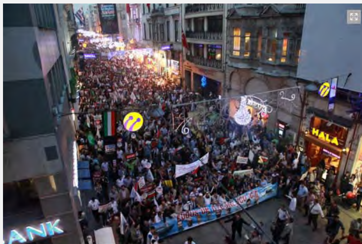
הצעדה בכיכר תקסים (אתר IHH 3 ביוני 2012)

■ בנאום, שנשא בולנט ילדרים ראש ארגון IHH, הוא התייחס לתביעה המשפטית, שהוגשה על ידי ממשלת תורכיה 3 . לדבריו לא יישפטו רק ארבעה אנשים אלא בדעת ארגונו לאתר את כל מי שהיה שותף לאירועי המשט. לדבריו המאבק נגד אלה שביצעו עת הפשע הזה ימשך שנים.