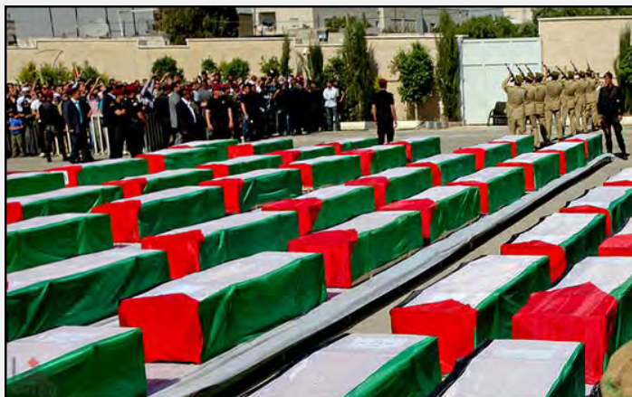
Les cercueils des terroristes exposés à la Muqaata (Agence de presse Wafa, 31 mai 2012)

Al-Jadeeda, 31 mai 2012). L'Autorité Palestinienne et l'administration de facto du Hamas dans la bande de Gaza ont organisé des cérémonies militaires officielles pour les corps. Une cérémonie officielle a été organisée à la Muqaata à Ramallah, en présence de Mahmoud Abbas, de membres de la direction palestinienne et des familles des terroristes morts (Agence de presse Wafa, 31 mai 2012).