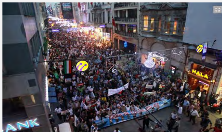
Le défilé place Taksim

■ Le 31 mai, divers événements ont été organisés à Istanbul pour marquer le deuxième anniversaire du Mavi Marmara, dont un défilé place Taksim au cœur de la ville. Selon le site Internet de l'IHH, 30 000 personnes y ont assisté. Les manifestants ont arboré des affiches commémorant les morts, exprimant la solidarité avec les Palestiniens et critiquant le Président syrien Bashar Assad.