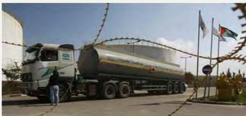
Camion d'essence en route pour Gaza (Site Internet des Brigades Izz al-Din al-Qassam, 5 juin 2012)

■ L'autorité des terminaux dans la bande de Gaza a annoncé dans un communiqué que les autorités égyptiennes n'avaient pas encore autorisé la livraison dans la bande de Gaza du carburant envoyé par le Qatar. Selon l'autorité gazaouite, il est possible que le jeudi 7 juin, la livraison soit permise par le terminal de Kerem Shalom. Les autorités égyptiennes justifient le retard par des "questions techniques". Israël a déjà accepté de laisser les camions entrer par le terminal de Kerem Shalom (Site Internet des Brigades Izz al-Din al-Qassam, 5 juin 2012).