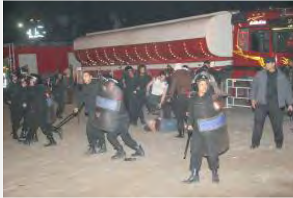
כוחות מצריים מתעמתים עם אנשי שיירת "עורק חיים 3" באלעריש על רקע סירוב שלטונות מצרים להתיר כניסת חלק מהמשאיות דרך מעבר רפיח (ihh.org.tr, ינואר 2010)

7. בעקבות התקרית האלימה הודיעה מצרים, כי לא תאפשר כניסת שיירה דומה לשטחה והכריזה על ג'ורג' גאלאוי כ"אישיות בלתי רצויה" . מאז נוהגים המצרים משנה זהירות במתן אישורי כניסה לפעילים והם אוסרים כניסתם של פעילים שהיו מעורבים בעבר בעימותים אלימים. בעבר, בימי משטרו של מבארכ, גם נאסרה כניסתם של פעילים שהיו המזוהים עם תנועת האחים המוסלמים והאסלאם הרדיקלי ופעילים בריטים המזוהים עם השמאל הקיצוני 6 . מהסירוב להתיר את כניסת השיירה השישית אנו למדים כי מדיניות מצרים זו נותרה בעינה גם לאחר הפלת משטר מבארכ.