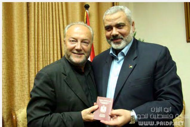
אסמאעיל הניה מעניק לג'ורג' גאלאוי דרכון פלסטיני (Paldf, 11 במרץ 2009)

5. בעת פגישה עם אסמאעיל הניה, ראש ממשל חמאס, בפברואר 2009 אמר כי המשלחות המוסלמיות וממדינות אירופה לרצועת עזה מוכיחות, כי "העתיד אינו של הכיבוש". בפנותו להניה אמר "אתה לא רק ראש הממשלה של פלסטין אלא גם ראש הממשלה שלנו". באותה פגישה העניק לו אסמאעיל הניה דרכון פלסטיני. בראיון שנתן ביוני 2011 לערוץ הטלוויזיה Palestine Today אמר גאלאוי "כאשר הנשיא אובמה מדבר על פלסטין קטנה אנחנו צריכים להתקש, כי פלסטין היא אחת - מן הנהר אל הים " (ברוח האידיאולוגיה של חמאס).