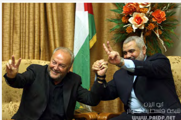
ג'ורג' גאלאוי ואסמאעיל הניה. במפה שאוחז הניה אין זכר לישראל (Paldf, 11 במרץ 2009)

5. בעת פגישה עם אסמאעיל הניה, ראש ממשל חמאס, בפברואר 2009 אמר כי המשלחות המוסלמיות וממדינות אירופה לרצועת עזה מוכיחות, כי "העתיד אינו של הכיבוש". בפנותו להניה אמר "אתה לא רק ראש הממשלה של פלסטין אלא גם ראש הממשלה שלנו". באותה פגישה העניק לו אסמאעיל הניה דרכון פלסטיני. בראיון שנתן ביוני 2011 לערוץ הטלוויזיה Palestine Today אמר גאלאוי "כאשר הנשיא אובמה מדבר על פלסטין קטנה אנחנו צריכים להתקש, כי פלסטין היא אחת - מן הנהר אל הים " (ברוח האידיאולוגיה של חמאס).